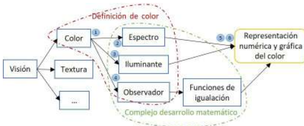
Figura 1. Mapa de contenidos y problemas.

En la siguiente figura se muestra el mapa de contenidos y problemas de los seminarios de la asignatura en los que se ha aplicado el CIMA.