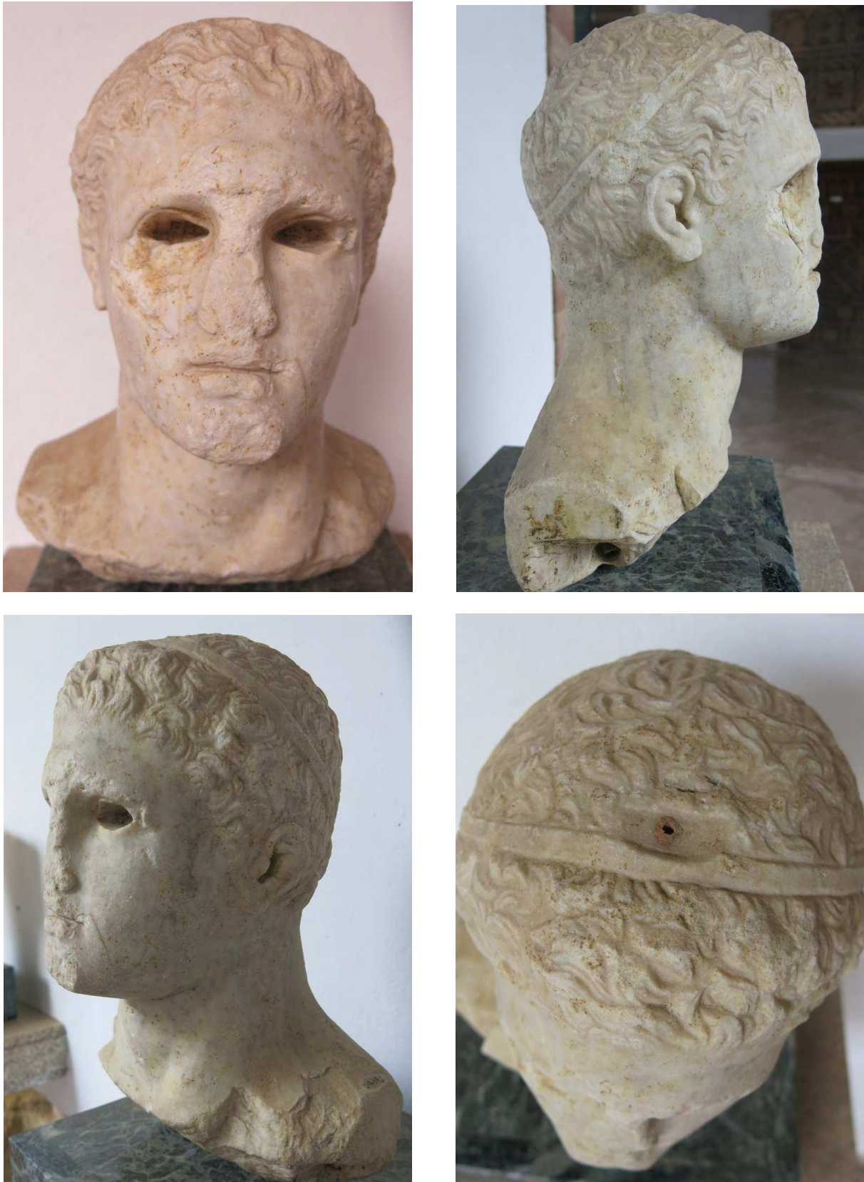
Figura 1. Herma romano de colonia Patricia (Córdoba): a. Frente; b. Lateral derecho; c. Lateral izquierdo; d. Parte superior. Museo Arqueológico y Etnográfico de Córdoba.