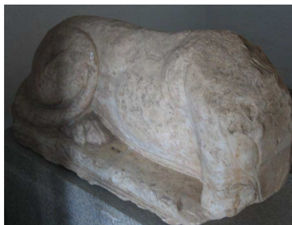
Figura 4. Estatua de esfinge de tipo egipcio, procedente de los Altos de Santa Ana (Córdoba). Museo Arqueológico y Etnográfico de Córdoba.

principado augusteo (González, 2007; Beltrán y Stylow, 2007); en todo caso se completaría en época tiberiana con los retratos citados de Tiberio y Livia (tipo Salus ). Más difícil es justificar la presencia de un herma del monarca Ptolomeo III en ese contexto de culto imperial.