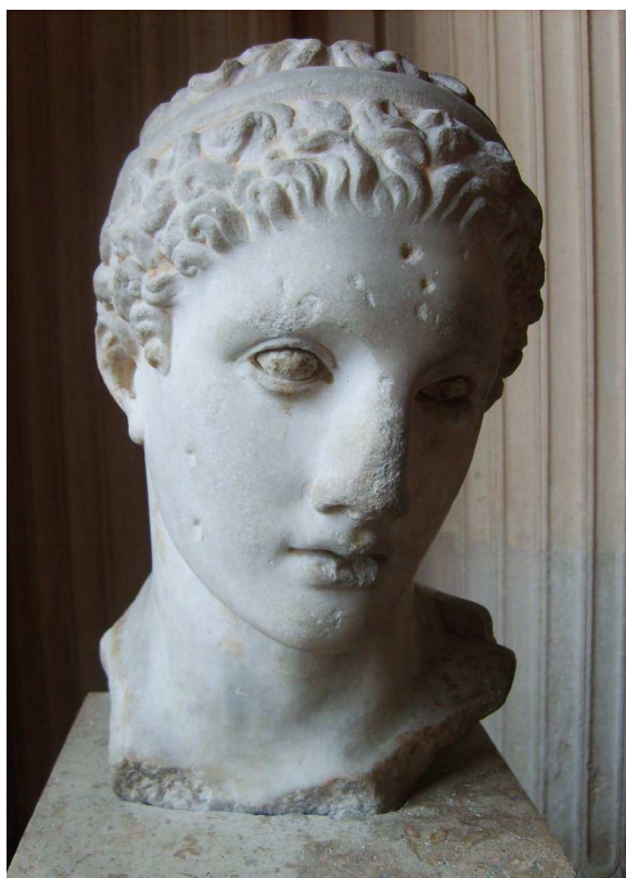
Figura 2. Cabeza romana de colonia Patricia (Córdoba). Museo del Louvre.

iconográfica la que advertimos en la pieza cordobesa. Según ya concluíamos anteriormente: “La individualización de los rasgos físicos y la elección del pilar hermaico como soporte del busto –en cuyo estípite, hoy perdido, pudo ir una inscripción, que identificaría con certeza al personaje allí efigiado– apuntaría a que el representado sea un determinado personaje histórico de los primeros momentos del helenismo, pero asimilado a la figura de Hércules” (Loza, 1993, p. 265).