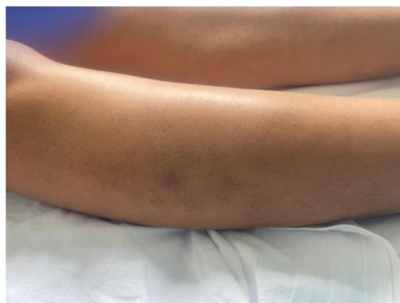
Figura 1 Lesión nodular de 2 cm de diámetro, de superficie pardusca en cara externa de la pierna derecha.

La paciente fue ingresada para observación, y se inició tratamiento con ceftriaxona, enoxaparina e hidrocortisona. Además, se pautó betametasona en crema en las lesiones cutáneas. La paciente mejoró significativamente en pocos días, permitiendo su alta hospitalaria y aislamiento domiciliario.