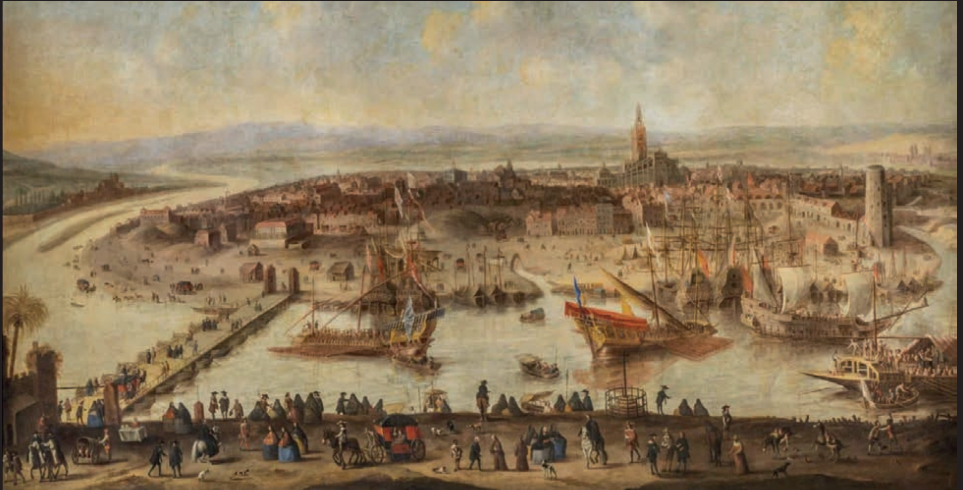
Fragmento de Vista de Sevilla , h. 1660. Óleo sobre lienzo, 163 x 274 cm. Fundación FOCUS, Hospital de los Venerables, Sevilla

de las que han sido abandonadas a su incierto porvenir de obra de arte, es posible apreciar lo imperceptible para la ceguera de la urgencia contemporánea. Descubrir lo que el ojo analítico solo puede detectar en presencia de la realidad objetiva: la infinitud de ventanas, los miles de balcones deshabitados, el verde de los toldos que dan sombra a diez kilómetros de distancia, los edificios que cristalizan bajo la luz implacable de los días tórridos, las directrices delineadas con lápiz, el trazo del pincel, los orificios dejados por las chinchetas que sujetaron los hilos, la textura terrestre de la pintura, el deterioro, el cuarteamiento de la cal y los ungüentos, lo desollado, el paso del tiempo, las huellas dactilares, la partitura de la ciudad sonora, la belleza, la conmovedora belleza, la belleza verdadera de lo frágil e inconcluso, la indudable persistencia de un artista calígrafo ejerciendo de arquitecto renacentista.*