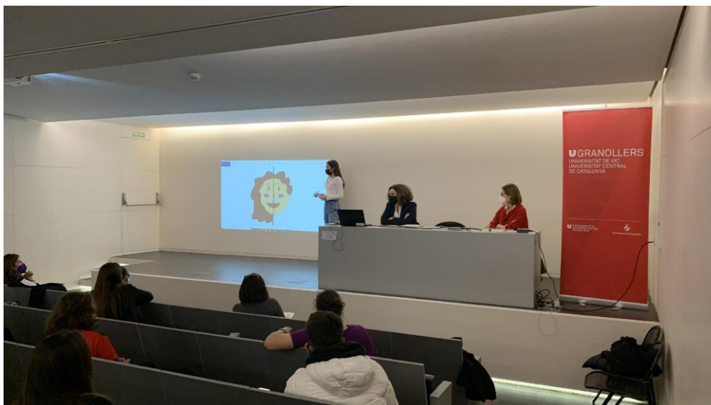
Imagen 2. Fotografía tomada durante la presentación del icono igualitario