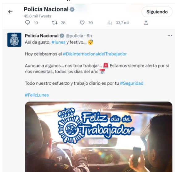
Imagen 1: Publicación realizada por la Policía Nacional con motivo del día del trabajador.

En la imagen 1 se aprecia un tuit de la Policía Nacional publicado el uno de mayo con motivo de la celebración del día del trabajador: