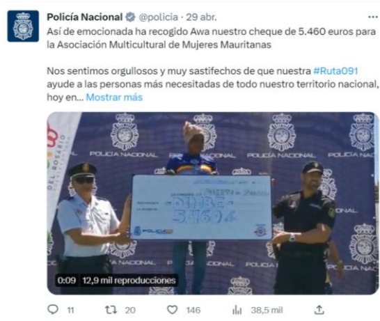
Imagen 7: Tuit de la Policía mostrando un cheque solidario otorgado

En la imagen 7 se observa un tuit de la Policía en el que aparece expuesto un cheque monetario procedente de la Policía Nacional y que tiene como destino la Asociación Multicultural de Mujeres Mauritanas: