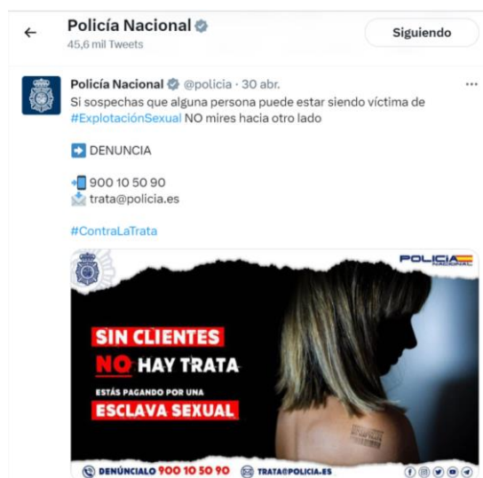
Imagen 2: Tuit de la Policía Nacional contra la explotación sexual de mujeres.

En la imagen 2 se aprecia un tuit de la Policía Nacional en el que predomina el lema contra la violencia sobre mujeres “Sin clientes no hay trata”: