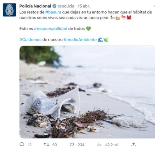
Imagen 6: Tuit de la Policía Nacional en favor del reciclaje y el cuidado del medioambiente.

La imagen 6 corresponde a un tuit de la Policía Nacional en el que se fotografía basura cerca de una playa para hacer un llamamiento a la responsabilidad y el reciclaje: