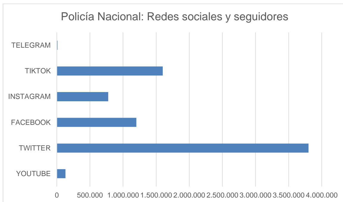
Gráfico 1: Policía Nacional: Redes sociales y seguidores