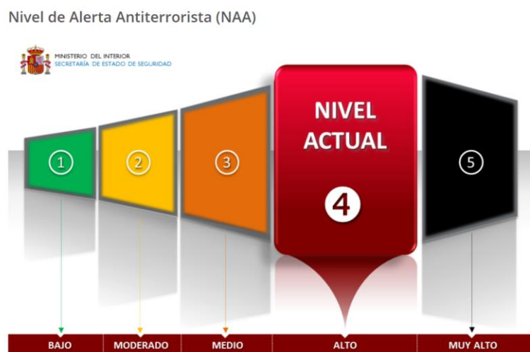
Imagen 11: Gráfica del Nivel de Alerta Antiterrorista

En la imagen 9 se aprecia una gráfica del Ministerio del Interior muy colorida en la que se representan los cinco niveles de alerta antiterrorista existentes en España. Los niveles de alerta antiterrorista son un indicador del riesgo social, en base a sucesos acontecidos e investigaciones policiales, de sufrir un atentado. Existe un nivel para cada situación social, comenzando por el verde, en el que el riesgo es bajo; y terminando por el negro, donde el riesgo es muy alto. El actual es el rojo, el de riesgo alto, y está activado por el Ministerio del Interior 48 :