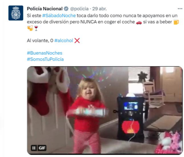
Imagen 10: Tuit de la Policía Nacional alertando de no consumir alcohol si conduces

En la imagen 15 se muestra una publicación realizada por la Policía Nacional en Twitter con la que se recuerda la importancia de no consumir alcohol si, posteriormente, se va a conducir: