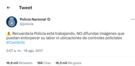
Imagen 13: Segundo tuit policial de alerta por atentado en las Ramblas

17 y 18/8/2017