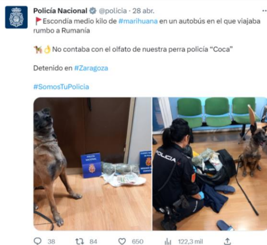
Imagen 8: Tuit de la Policía mostrando los resultados de una incautación

Fuente: Twitter de la Policía Nacional. 29 y 28/4/2023