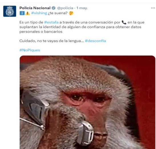
Imagen 9: Tuit de la Policía Nacional sobre el “vishing”

En la imagen 14 se aprecia un tuit de la Policía alertando sobre un nuevo tipo de estafa, el “vishing”: