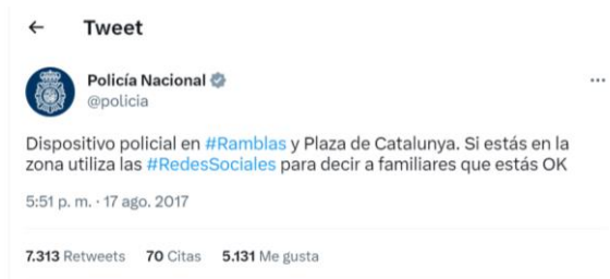
Imagen 12: Tuit policial de alerta por atentado en las Ramblas

En las imágenes 10 y 11 se aprecian publicaciones en Twitter de la Policía Nacional tras el atentado en las Ramblas de Barcelona.