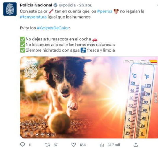
Imagen 5: Tuit de la Policía Nacional relativo al cuidado de mascotas y el calor.