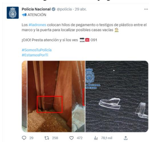
Imagen 4: Publicación de la Policía Nacional para alertar de nuevos métodos empleados por ladrones.

En la imagen 4 se aprecian varios mecanismos utilizados por ladrones para saber si las casas están ocupadas, tales como testigos o hilos de pegamento: