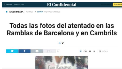
Imagen 14: Titular de 'El Confidencial' por el mismo atentado