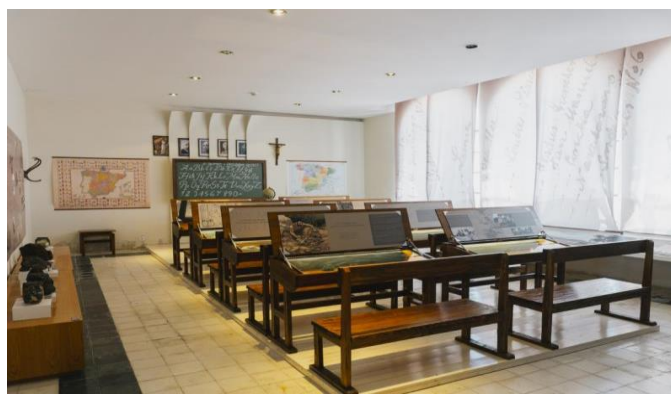
Figura 2.10. Sala Ingeniero Elorza / Museo de la Minería.