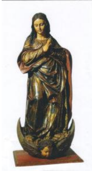
Figura 2.14. Primera Inmaculada de Martínez Montañés.

Es una bellísima Virgen aniñada, de poético y bello talante, cuyo concepto cambiará años después hacia la sublime interpretación de la Theotocos. La representa en oración, la mirada baja y las manos puestas oracionalmente en forma ovalada (...) (Hernández, 1968; en García, 2013:1)