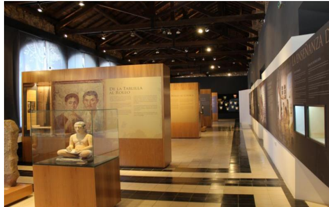
Figura 2.11. Museo de la escritura.