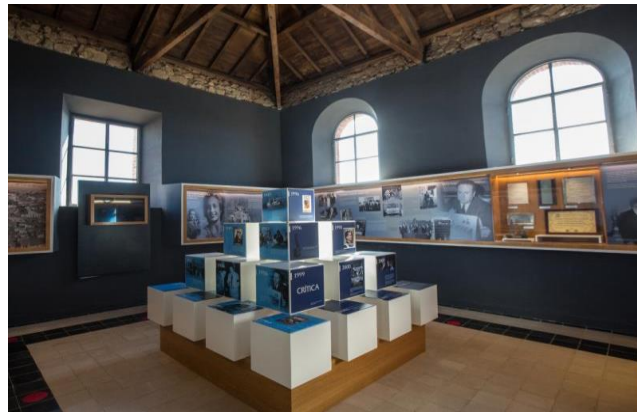
Figura 2.12. Museo de D. José Manuel Lara Bosch.

Fuente: Elaboración propia a partir de La fundición de El Pedroso.