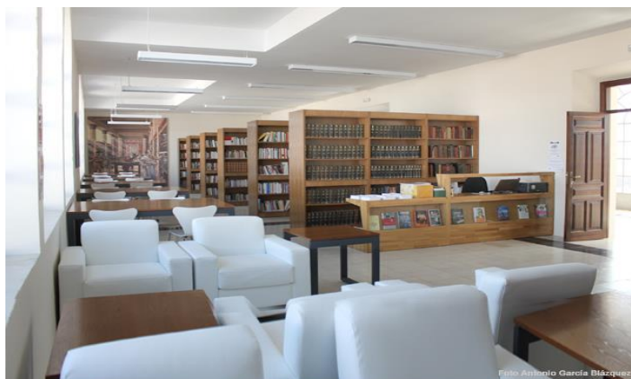
Figura 2.8. Biblioteca José Manuel Lara Bosch / Guadalinfo.

El edificio escuelas nuevas se divide en: Planta baja.