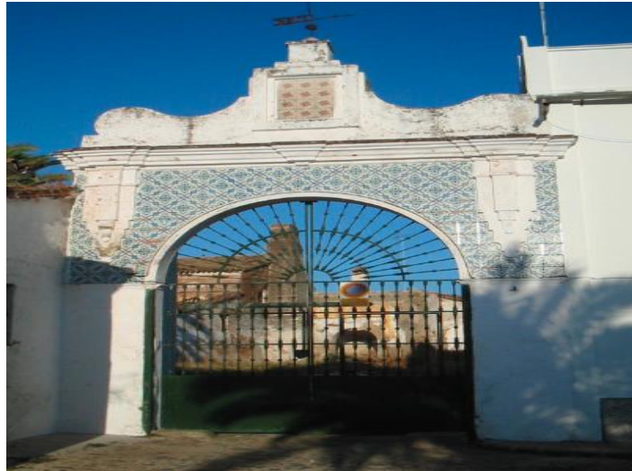
Figura 2.1. Puerta del Monasterio Cartujo, El Pedroso.

Cartuja de Cazalla de la Sierra como de los monjes de Santa María de las Cuevas afincados en Sevilla capital. En 2005 los edificios que en una época fueron destinados a la industria extractora del aceite, se encontraban ya por aquel entonces derruidos, tanto el molino como el almacén, el edificio principal y la vivienda de los monjes cartujos, en 2005 era habitado por sus propietarios. (Toni Durán, 2005) Actualmente, he podido preguntar a vecinos cercanos a la Cartuja y me dicen que no está habitado desde hace años pero que no es de uso público.