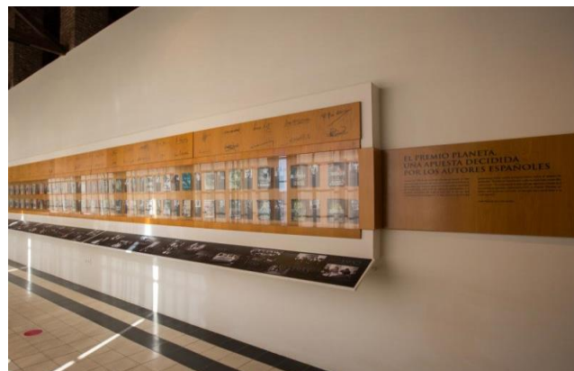
Figura 2.13. Galería de los premios Planeta