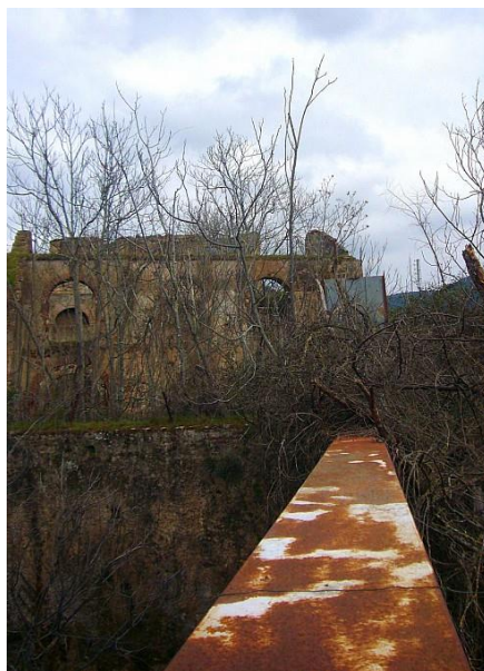
Figura 2.7. Fábrica de Hierros de El Pedroso.