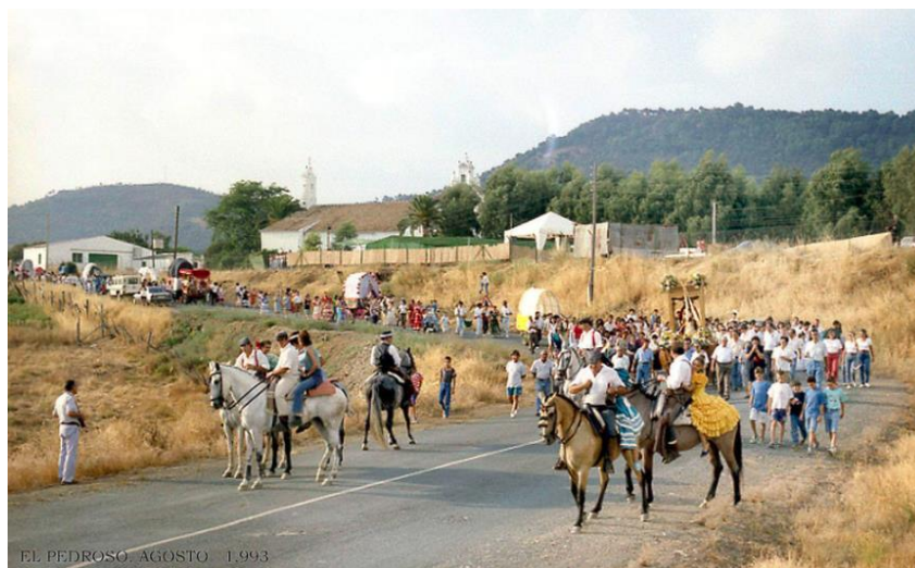
Figura 2.16. Primera romería después de la guerra civil española

Según he podido indagar charlando con vecinos del municipio, cada cual me cuenta una versión distinta de por qué esto ha sido así desde 2010. Una vertiente del municipio afirma que es porque la hermandad no quería un camino tan largo con condiciones meteorológicas de temperaturas tan altas. Otra vertiente me añade que la rivera del Huéznar no estaba en condiciones óptimas para la peregrinación pudiendo causar allí incendios y diferentes altercados con los caballistas ebrios. La siguiente vertiente me comenta que si queremos atraer a personas a la fiesta como se hacía antes, en el 1999 tenemos que recuperar el camino a la rivera porque siendo el camino primigenio por el propio municipio es imposible atraer población ya que no hay una convivencia como la había antaño porque la peregrinación es en un enclave rural con un paisaje poco boscoso y más urbanita ya que es por las propias calles del pueblo.