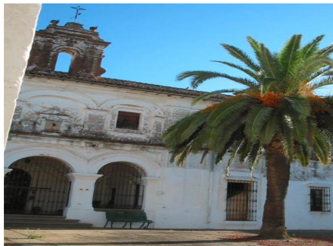
Figura 2.2. Monasterio Cartujo, El Pedroso.