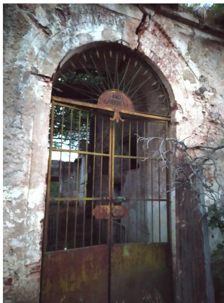
Figura 2.6. Puerta de Fábrica de Hierros de El Pedroso 1886.