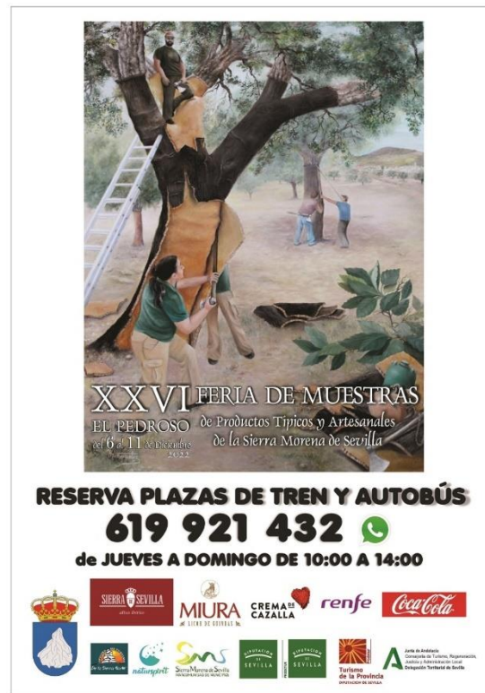
Figura 2.18. Cartel XXVI Feria de Muestras de El Pedroso.