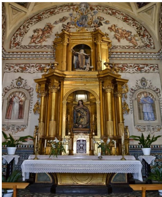
Figura 2.15. Retablo de la Inmaculada de El Pedroso.