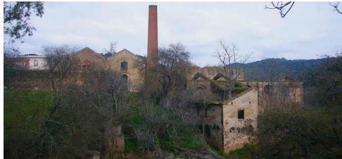
Figura 2.5. Panorámica de Fábrica de Hierros de El Pedroso.

Poco queda de lo que era la Fábrica de Hierros, ahora el bosque está volviendo a su lugar y sigue siendo un enclave digno de admirar, podemos encontrar a veces visitas a esta, aunque no es de libre acceso, siempre se hacen las visitas concertándolas previamente con la oficina de turismo del municipio.