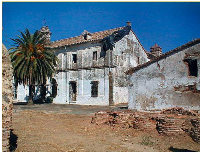
Figura 2.3. Monasterio Cartujo, El Pedroso.