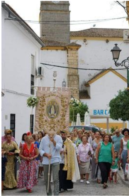
Figura 2.17. Romería Año 2022