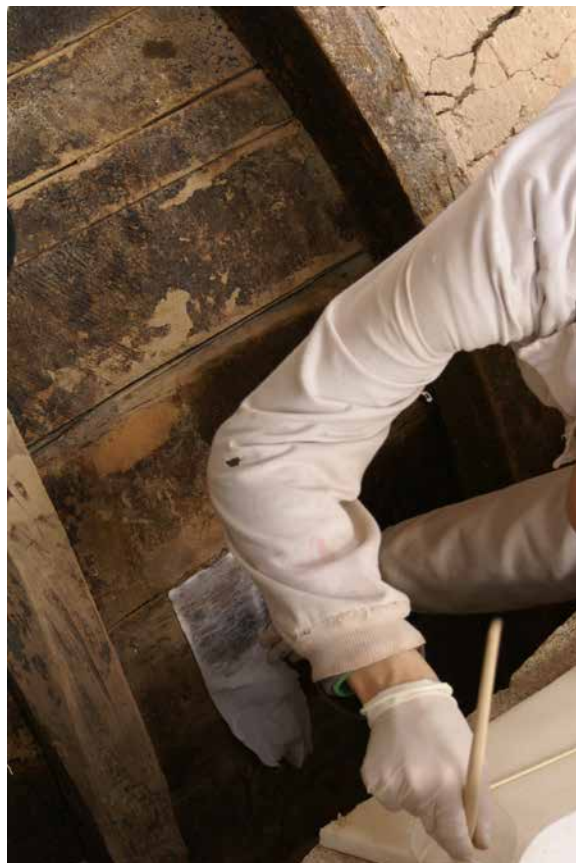
Il. 9. Bóveda 3. Tratamiento de conservación-restauración. Proceso de limpieza. Benjamín Domínguez, 2007. GESTIONARTE S.L.U.

La limpieza de los elementos metálicos se realizó mecánicamente con un pequeño cepillo de cerda dura, sobre la superficie del