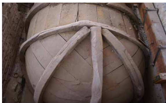
Il. 2.: Bóveda 1. Fotografía previa a la intervención. Detalle del sistema constructivo. Benjamín Domínguez. Fotografía previa a la intervención. Detalle del sistema constructivo, 2007. GESTIONARTE S.L.U.

Las tablas de la parte central de la bóveda son completas en su mayor parte aunque existe algún ejemplo de unión por no completar la longitud deseada. Las tablas se clavaron independientemente a las costillas, una a una, hasta cubrir toda la superficie. Las tablas de alrededor de 15 centímetros cubren las