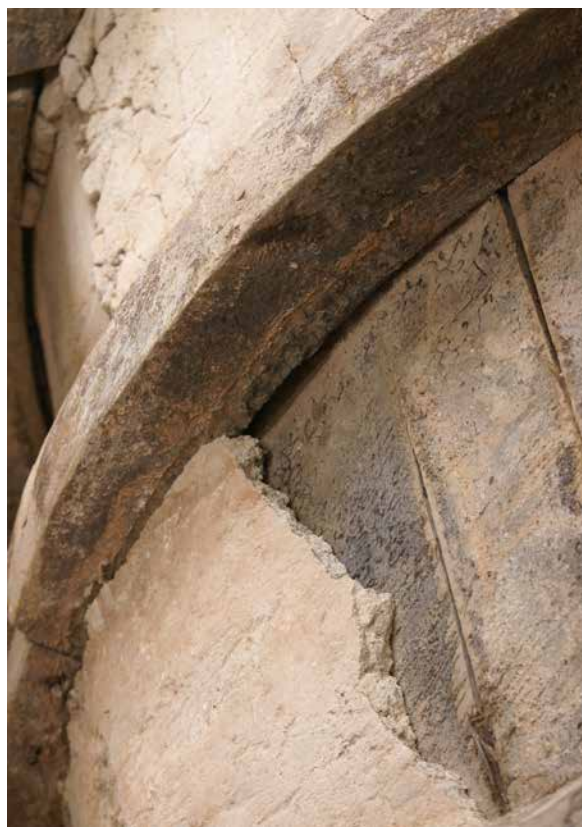
II. 3. Bóveda 3. Detalle de las dos capas de cubrición, capa resinosa y yesos. Benjamín Domínguez, Bóveda 3. Detalle de las dos capas de cubrición, capa resinosa y yesos, 2008. GESTIONARTE S.L.U.

partes más planas del arco y, las de medidas inferiores a éstas, se han dispuesto en las partes más curvas. Las juntas abiertas entre las tablas aparecen selladas con chirlatas insertas en los huecos por medio de presión. Las tablas más gruesas presentan muescas de azuela en las zonas de contacto con las costillas para nivelar la superficie interior que sería posteriormente recubierta de cuero. Posteriormente, se completa la cubrición con tablas de los cascarones de la bóveda. La solución que los carpinteros han buscado para recubrir esta superficie curva ha sido mediante el corte de las tablas en forma de triángulo, para posteriormente curvar la punta. Las puntas de las tablas están fijadas a las tablas contiguas con un clavo pasante con cabeza. La cabeza está embotada en la madera, donde previamente se ha practicado una incisión con una gubia curva.