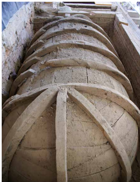
Il. 1. Bóveda 2. Fotografía previa a la intervención. Fotografía previa a la intervención.