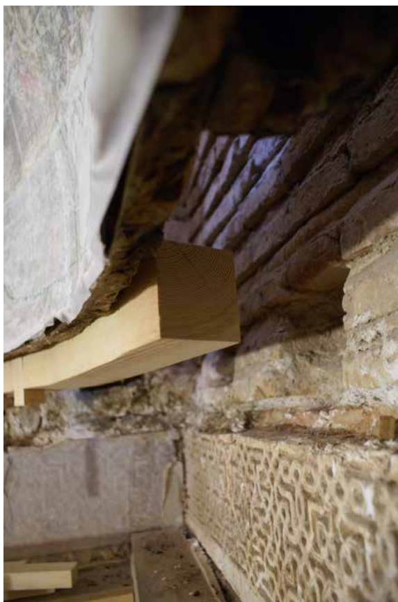
Il. 13. Bóveda 1. Tratamiento de conservación-restauración. Reconstrucción de la “costilla base”. Benjamín Domínguez, 2008. GESTIONARTE S.L.U.