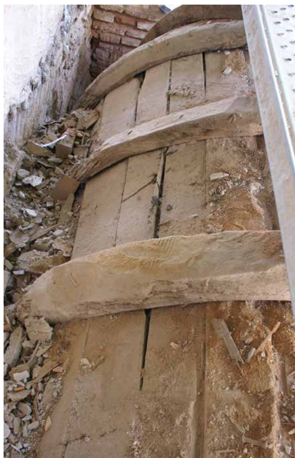
Il. 4. Bóveda 3. Estado de conservación previo a la intervención. Benjamín Domínguez. Estado de conservación previo a la intervención, 2007. GESTIONARTE S.L.U.