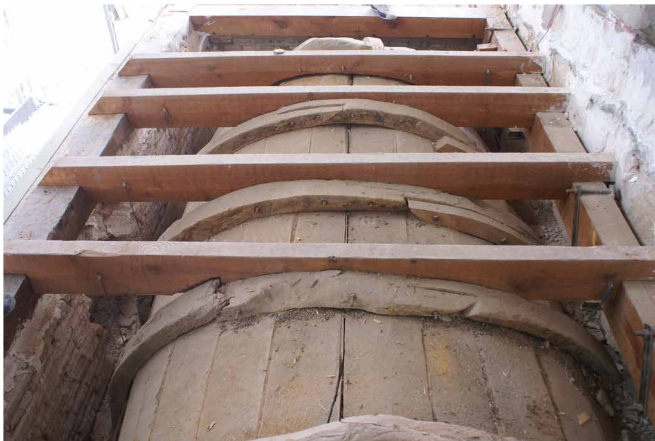
Il. 6. Bóveda 1. Refuerzos incorporados en la intervención de 1980. Benjamín Domínguez. Refuerzos incorporados en la intervención de 1980, 2007. GESTIONARTE S.L.U.

costillas. A consecuencia de este agente de deterioro, la madera estaba muy alterada, presentando una superficie friable propia de la denominada “pudrición parda” (Il. 5).