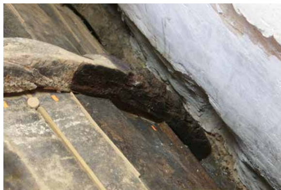
Il. 10. Bóveda 2. Tratamiento de conservación-restauración. Consolidación de la madera afectada por pudrición. Benjamín Domínguez, 2007. GESTIONARTE S.L.U.