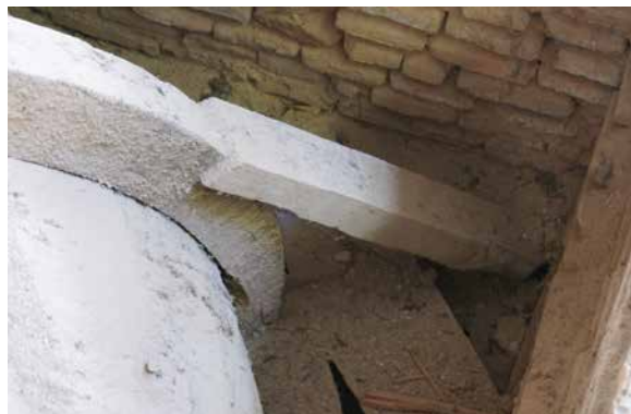
Il. 7. Bóveda 2. Refuerzos o “muletas” incorporados en las actuaciones acometidas en la década de los ochenta. Benjamín Domínguez. Refuerzos o “muletas” incorporados en las actuaciones acometidas en la década de los ochenta, 2007. GESTIONARTE S.L.U.