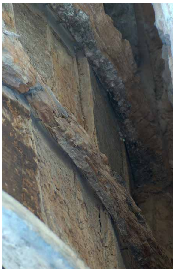
Il. 5. Bóveda 3. Detalle pudrición de las costillas. Zona leones. Benjamín Domínguez. Detalle pudrición de las costillas. Zona leones, 2007. GESTIONARTE S.L.U.

los trabajos realizados a una restauración por fases por el restaurador afincado en Madrid D. Juan Santos Ramos 22 . Entre la documentación referente a esos trabajos hemos encontrado referencias a los trabajos sobre el soporte de madera, llevados a cabo durante la campaña de 1980 en la bóveda 1, describiéndose en el informe con fecha 19 de octubre de 1980 los diferentes trabajos de limpieza, sujeción con tornillería de latón, doblaje de costillas, sustitución de listones podridos, colocación de chirlatas, etc. que han sido perfectamente localizados en esta última actuación.