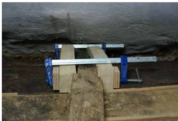
Il. 12. T Bóveda 2. ratamiento de conservación-restauración. Colocación de refuerzos. T Benjamín Domínguez, 2008. GESTIONARTE S.L.U.

A pesar de que se pretendió que todas las soluciones técnicas fuesen homogéneas, en la bóveda 1 hubo de llevarse a cabo una excepción en lo concerniente al ensamblaje de una de las costillas con el anillo base. Concretamente, en la correspondiente a la transición entre el lateral de leones y el casquete B. Y es que la imposibilidad de acceder hasta este punto y colocar sargentos de apriete, tornillería u otro elemento que permitiese el correcto ensamblaje y fraguado de los adhesivos en la colocación de los refuerzos, obligó a adoptar una solución diferente. La solución adoptada fue la de unir las dos piezas de madera mediante una escuadra de acero inoxidable