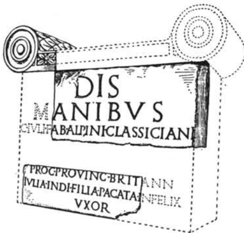
FIG. 2. Reconstrucción ideal del mausoleo de Ivlivs Classicianvs, según J. Liversidge.