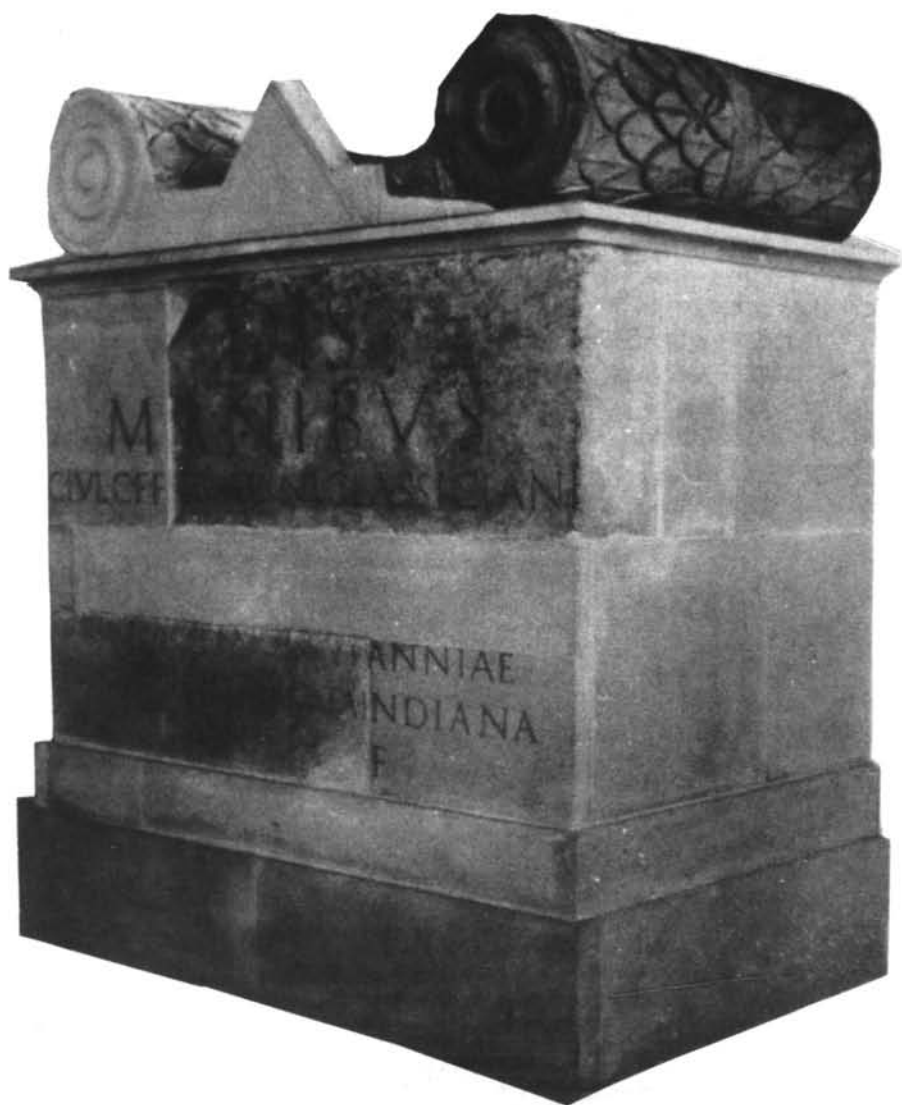
LÁM. I. Mausoleo de IVLIVS CLASSICIANVS . Reconstrucción ( British Museum ).