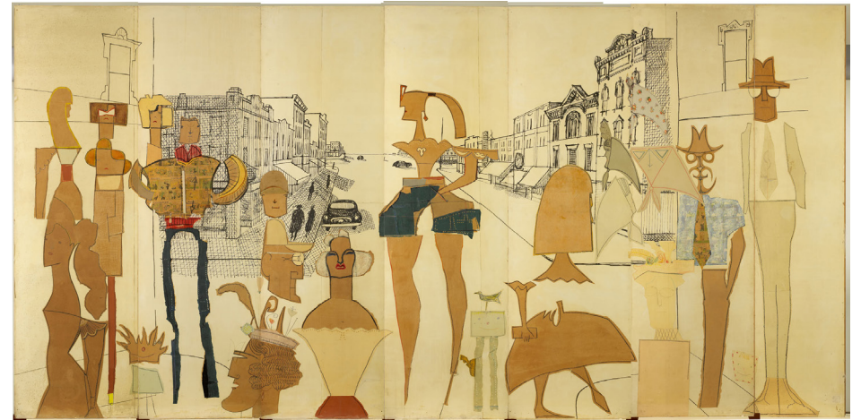
Fig. 3. Main Street—Small Town , from The Americans , Saul Steinberg, 1958, Musée Royaux B. A. Bélgica.

puntillas por sus calles; compartiendo la vida , mezcladas y macladas unas con otras con pies pesados y arraigados; o mirando la vida —y estas figuras son las que más proliferan—: ahí están los mirones, los voyeurs , observando a las guapas que pasan, pero también atentos a los cambios y a los acontecimientos que no cesan.