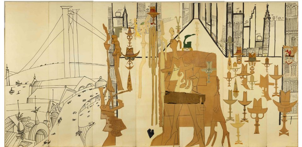
Fig. 4. Downtown-Big-City from The Americans , Saul Steinberg, 1958, Musée Royaux B. A. Bélgica.

-el Patrimonio y la Ecología- han ido proporcionando tímidos ensayos de convivencia que iba tranquilizando las conciencias de los más inquietos. Del mismo modo y en la misma línea, las propuestas del cooperativismo y la coparticipación residencial están proporcionando nuevas alternativas en los modos de compartir el espacio de lo doméstico y en las formas de estar en la ciudad 11 . Pero tal vez estas últimas propuestas haya que leerlas bajo otras claves sin excederse en elogios. Eso es lo que nos recomienda Cristina Bianchetti cuando nos dice que habría que “desdramatizar una representación de la coparticipación que se presenta como respuesta superior impregnada de los valores morales de solidaridad, de retóricas de la gratuidad, de capacidad de autoorganización y autogobierno de la sociedad.” (Becchi et al., 2017:75)