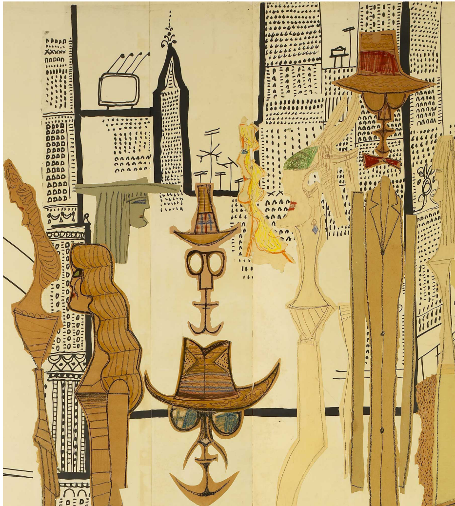
Fig. 1. Downtown-Big-City from The Americans , Saul Steinberg, 1958, Musée Royaux B. A. Bélgica. Detalle.