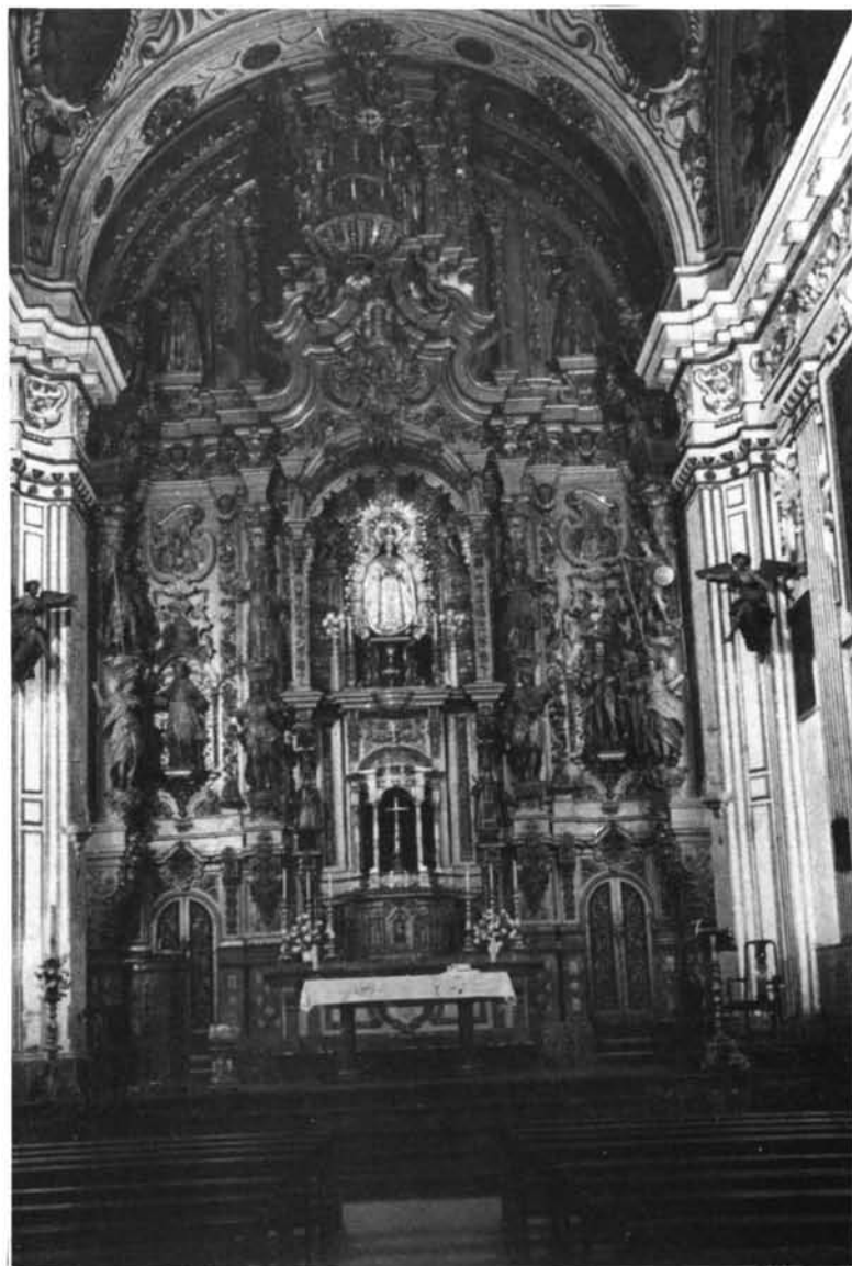
Fig. 6. Actual Retablo Mayor de la Iglesia Conventual de San Buenaventura que vino a sustituir en la última restauración del templo a la obra de José Fernandez.