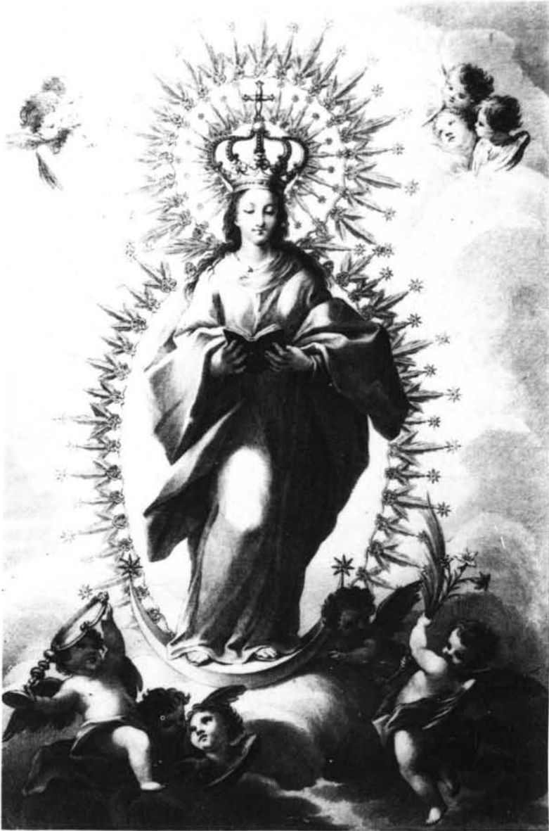
Fig. 5. Versión idealizada de la Concepción llamada "La Sevillana" que preside el Retablo Mayor de la Iglesia de San Buenaventura según un grabado de 1897.