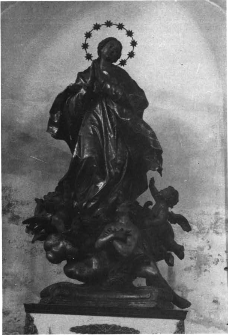
Fig. 7. Inmaculada de escuela Italiana (posiblemente napolitana), del s. XVIII. Estuvo presidiendo el retablo mayor de San Buenaventura, hasta la reposición de la "Sevillana", y entonces pasó al altar del Sagrario de dicha iglesia. 4-10-1916.