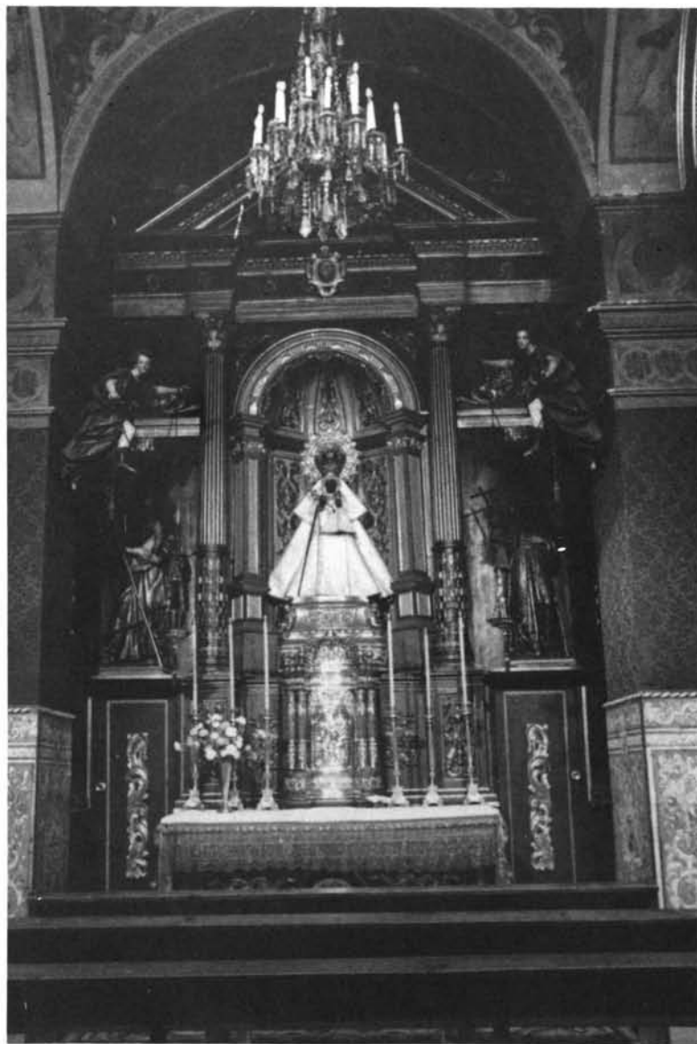
Fig. 4. Retablo de la Capilla del Sagrario de la Iglesia, de San Buenaventura. Este pertenece a la mano de José Fernández, lo mismo que el que en la misma capilla alberga a la Virgen del Patrocinio.