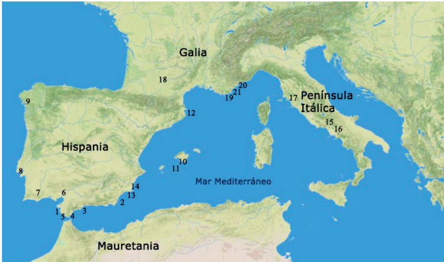
Figura 1: Mapa de las situaciones tratadas en el texto. 1, Bahía de Cádiz; 2, Baria; 3, Malaca; 4, Carteia; 5, Baelo Claudia; 6, Bajo Guadalquivir; 7, Algarve; 8, Lisboa; 9, Área castreña; 10, Colònia de Sant Jordi A; 11, Illa dels Conills; 12, Illa Pedrosa; 13, Escombreras; 14, Punta de Algas; 15, Garigliano; 16, Dugenta; 17, Albinia; 18, Toulouse; 19, Dramont C; 20, Fourmigue C; 21, Cap de l'Estérel.

cerámicas itálicas de barniz negro 5 que parecen atestiguar el consumo de importaciones de este origen a lo largo del siglo II y la primera mitad del I a. C. La pieza estudiada en estas páginas parece por tanto que acompañaría a dichas vajillas, que junto a algunos cubiletes de paredes finas (Mayet I-III), lucernas y cerámicas de cocina (Vegas 2, Vegas 14, platos-tapadera, etc.), resultan elementos relativamente frecuentes en los testares y rellenos de hornos o piletas excavados en el territorio insular gaditano para la etapa que tratamos.