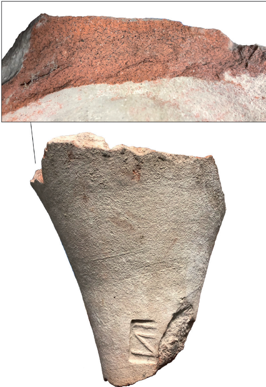
Figura 2: Fotografía de la pieza y detalle de la pasta cerámica.