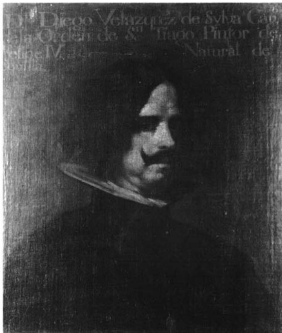
Diego de Velázquez.