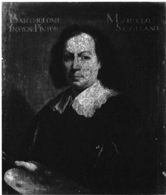
Bartolomé Esteban Murillo.