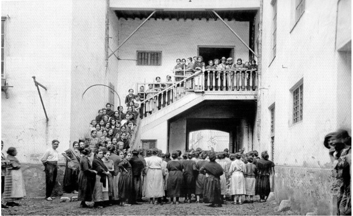
Fig. 3. Primera huelga de mujeres de Málaga, en 1890.

Esta será la situación de aquellas mujeres que componen la clase obrera, que se ven obligadas a trabajar en duras condiciones en fábricas donde lo que ganan no les da para sobrevivir. Partiendo de estas condiciones, donde no se podían garantizar ni el sustento diario, es comprensible que sus preocupaciones no pudieran ser de la misma índole de la de aquellas mujeres criadas sin penurias y que teniendo cubiertas sus necesidades básicas, podían permitirse preocuparse por otros menesteres en relación con la educación, la cultura o las artes.