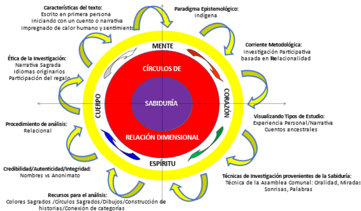
Imagen 3. Características de la Investigación Indígena.

La investigación indígena puede partir de la experiencia personal (Antone, 1997: 100) para dar a saber cómo se aprende. El investigador y el investigado participan a la par de un proceso de aprendizaje como una aventura, donde se pueden acordar, más que los métodos, las intenciones de la investigación ( Ibidem : 100). El investigador participa de un aprendizaje constante, sorpresas y descubrimientos inesperados, que añaden color y sabor a la investigación, principio de la nación anishnawbe ( Ibidem : 104).