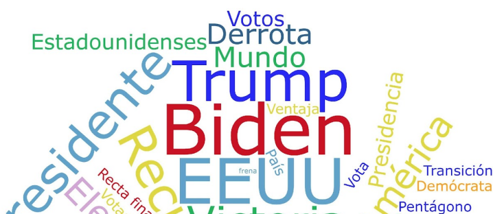
Imagen 2: Nube de palabras más usadas en los titulares principales.