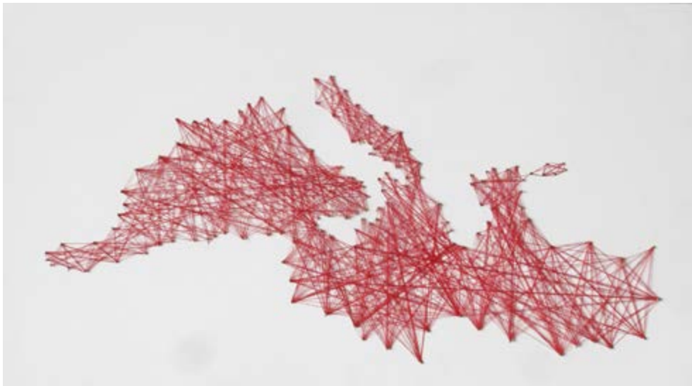
Imagen 11. Maqueta del Mediterráneo realizada con ocasión de la presentación de PAX en la XV Biennial Internacional de Arquitectura de Venecia.