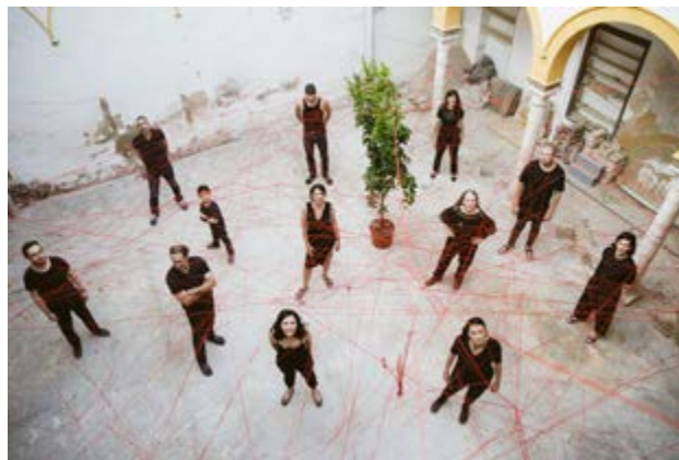
Imagen 5. Miembros del colectivo PAX durante una instalación para la XV Bienal Internacional de Arquitectura de Venecia.

Un grupo multidisciplinar de facilitadores, del ámbito de la arquitectura y la antropología, funda en abril de 2018 la Asociación PAX-Patios de la Axerquía como una herramienta para impulsar el proceso de innovación cultural y social e involucrar a asociaciones locales y ciudadanía, entidades públicas y privadas, mundo de la investigación en la práctica experimental acerca del casco histórico en un entorno urbano de alto valor y en riesgo de gentrificación. El re-uso de la ciudad existente, en su valor patrimonial material e inmaterial ligado a las casas de vecinos en un casco objeto de transformación por un creciente turismo, ha sido el impulso para generar una estrategia en cuanto a cultura urbana , a través de la actualización de los patios con procesos de innovación social y cooperativos para su uso residencial.