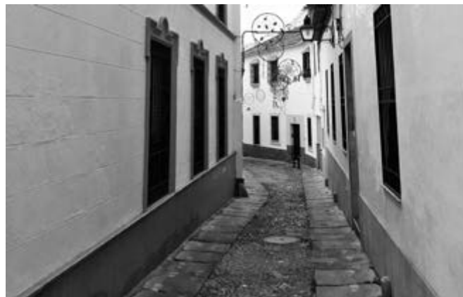
Imagen 4. Calle del barrio de la Axerquía en Córdoba.

la Axerquía— es una estrategia de reactivación urbana a través de procesos cooperativos, que persigue que la mejora sostenible del centro histórico no suponga la alienación social de zonas patrimoniales por el incremento de la presión turística. 5 La rehabilitación del barrio de la Axerquía, amenazado por la gentrificación, busca la recuperación del valor medioambiental y social de la urbe mediterránea y la actualización de su historia en clave contemporánea a través de la innovación social con la ciudadanía. La presencia de tipologías tradicionales —como las casas-patio o las casas de vecinos—, en muchos casos vacías o infrautilizadas como resultado de la burbuja, sugiere mecanismos de gobernanza que garanticen la rehabilitación y reactivación de este patrimonio arquitectónico y su valor inmaterial. El fomento de acciones que propicien la adquisición de casas-patio en desuso para la sucesiva rehabilitación por cooperativas habitacionales en cesión de su uso permite la salvaguarda de un patrimonio universal y su valor ambiental, promover empleo local y facilitar un tejido social, asociativo y solidario en el centro de la ciudad para un uso colectivo de los patios, tal y como fue reconocido por la UNESCO.