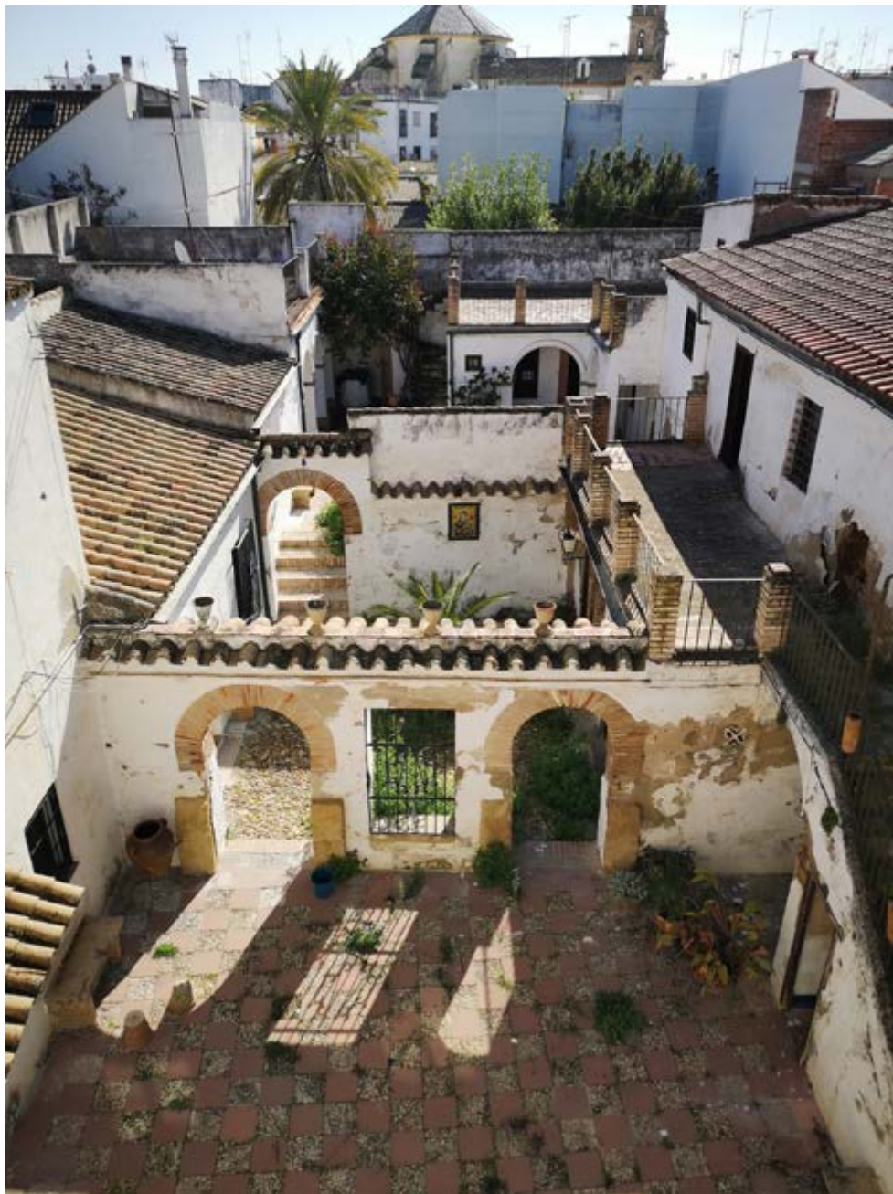
Imagen 9. Imagen actual de la casa en calle Montero, primera cooperativa PAX, antes de la rehabilitación.

afronta un nuevo reto: transformarse en los próximos años en una start-up de regeneración urbana e innovación social, como cooperativa de segundo nivel bottom up en entornos de alto valor patrimonial y que una a entidades públicas y privadas en un camino compartido para el futuro de una zona tan delicada entre lo global y lo local.