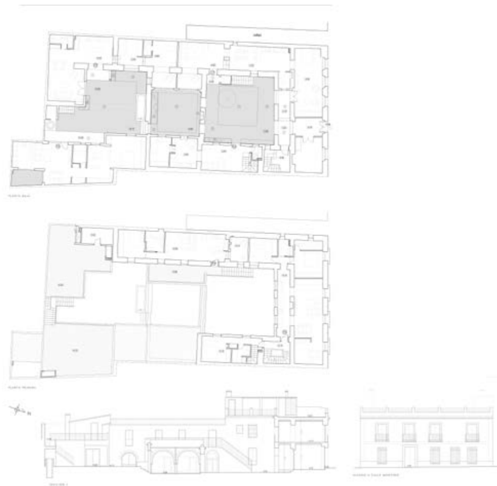
Imagen 10. Plantas, sección y alzado de la casa en calle Montero, primera cooperativa PAX - Fuente: Gaia Redaelli, Jacinta Ortiz, Carlos Anaya, arquitectos.