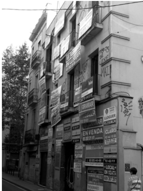
Imagen 2. Pisos en venta en Barcelona.

resulta especialmente interesante analizar si es posible contener esos procesos en acciones compartidas entre ciudad y ciudadanía , ya que la crisis ha afectado a ambos. Es decir, si es posible, desde el valor patrimonial observado bajo enfoques nuevos y en su componente social, el fomento de acciones de rehabilitación urbana e innovación social para usos contemporáneos en el respeto de su valor patrimonial.