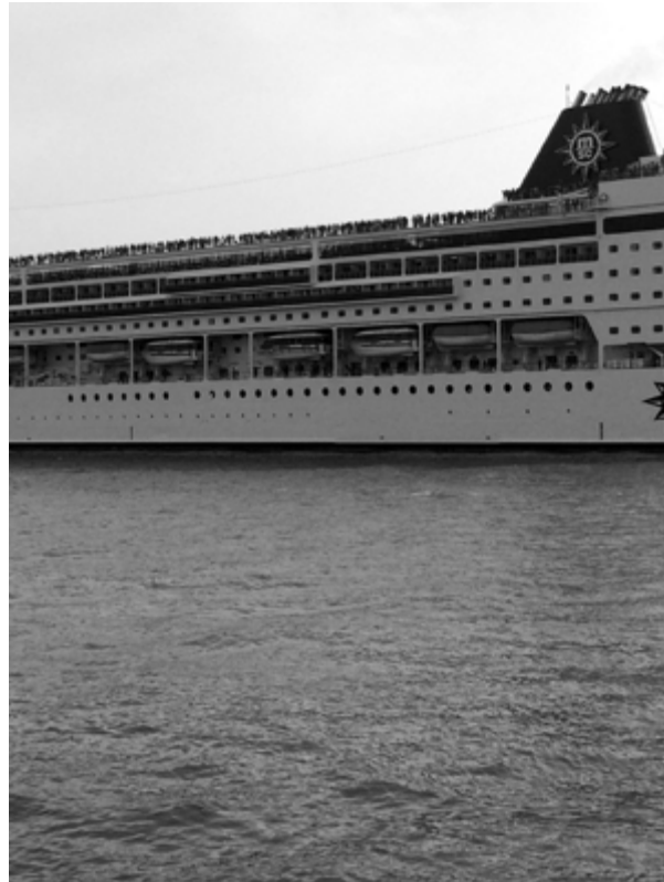
Imagen 1. Turistas observan Venecia desde un crucero en la Laguna.

rencias, resultan de interés por el grado de avance en cuanto a incidencia del turismo en su tejido urbano y social que la primera vive y ante el que la urbe catalana experimenta un intento de reacción desde lo público.