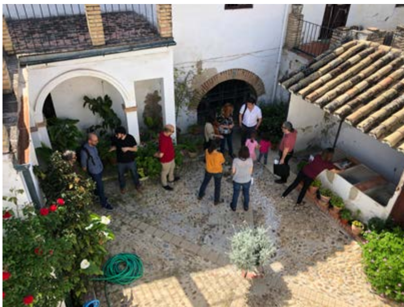
Imagen 7. Visita de miembros del Consejo de Europa a PAX, en el marco de la Faro Convention Network.