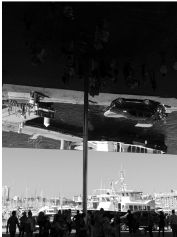
Imagen 3. Turistas debajo de la marquesina de Norman Foster, símbolo de las intervenciones en el Puerto Viejo de Marsella.

Generar un cambio de paradigma sobre qué es patrimonio y sobre su componente social se ha ido fortaleciendo en el caso de Hotel du Nord —no sin dificultades derivadas de la competencia de una falsa sharing economy como la de Airb&b. Tras casi una década de andadura, la experiencia de Marsella se abre a una visión más amplia. La cooperativa sigue desarrollando y construyendo nuevas alianzas, potenciando su impacto social y económico en el territorio y, ahora, en colaboración con el Estado francés, se ha transformado en una start up de cooperativas similares en el territorio nacional bajo el nombre Oisseaux de passage . La plataforma generada busca así poner en red y dar visibilidad a acciones ciudadanas y emprendimientos turísticos más sostenibles e integradores del patrimonio cultural y de la ciudadanía a partir de las experiencias de comunidades patrimoniales según lo indicado por Faro. 3