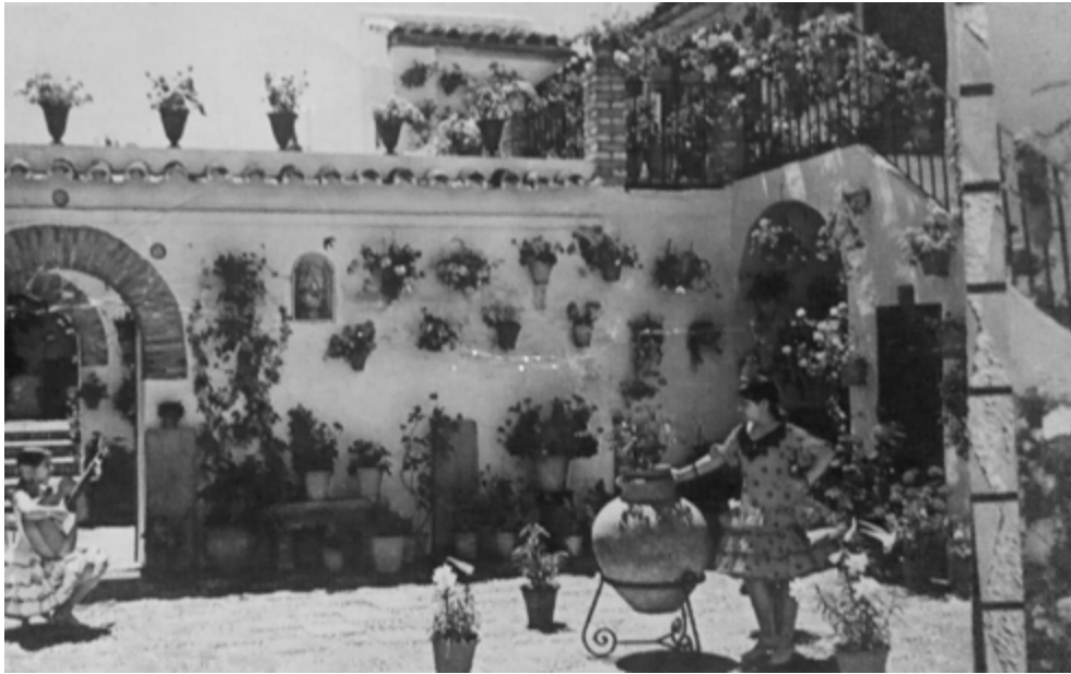
Imagen 8. Imagen histórica de la casa en calle Montero, primera cooperativa PAX.

Tras su constitución como Asociación, PAX ha realizado varias acciones de carácter cultural, tejiendo relaciones sobre todo con entidades locales y ciudadanía, también a través de la constitución, en 2018, del «Foro por el Derecho a la Ciudad de Córdoba» como lugar para compartir una idea común de futuro de la ciudad y la elaboración, entre otros, de un Acuerdo ciudadano. 7