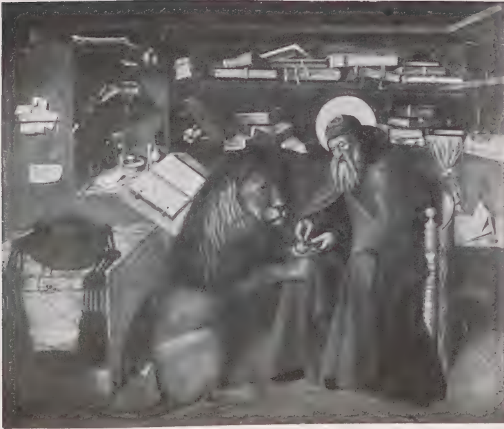
COLANGELO - S. GIROLAMO - Museo Nazionale di Napoli.