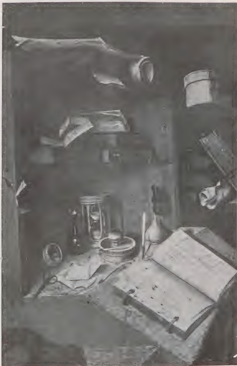
COLANGELO — S. GIROLAMO - Dettaglio.