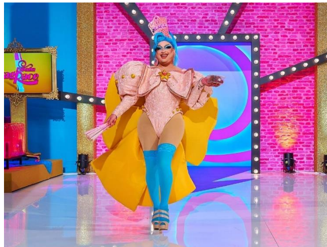
Imagen 4. Look de entrada de The Macarena en Drag Race España .

Las influencias folclóricas de The Macarena son visuales. Hace una reinterpretación de lo andaluz y su propio estilo dando lugar a looks tan memorables como el de su entrada en el concurso donde lucía como la protagonista de la serie de animación Sailor Moon (Naoko Takeuchi, 1991), a la par que incorporaba en su vestuario una peineta, abanico y pendientes típicos de flamenca. Estos elementos suelen ser recurrentes en sus estilismos.