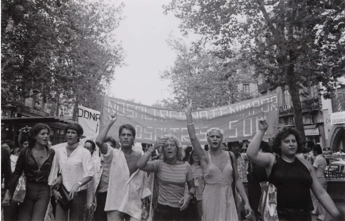
Imagen 1. Manifestantes por la liberación homosexual el 26 de junio de 1977 en La Rambla, Barcelona.