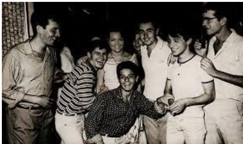
Imagen 3. Sara Montiel con admiradores en el Pasaje Begoña, Torremolinos.

moral nacionalcatólica asumida oficialmente por el franquismo y buena parte de la sociedad española. Un modelo de autosuficiencia, libre albedrío, provocación sensual (no tanto sexual), carencia de temor al pecado, rechazo de la subordinación a los hombres, un cierto cosmopolitismo (Carlos Prieto, 2013).