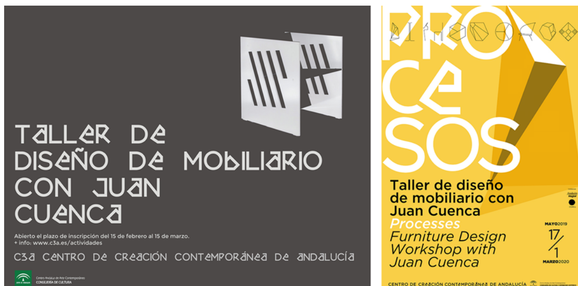
Figura 3. Izqda: Cartel anunciador de la convocatoria del Taller de Diseño de Mobiliario con Juan Cuenca. 2018. Dcha: Cartel anunciador de la exposición Procesos . 2019. Diseño Zum Creativos.

a la transmisión de parte del legado del siglo XX. Así mismo, también se planteó como fin último, transferir el conocimiento generado a la sociedad de forma que ésta también fuera partícipe de estas temáticas y estuviera cada vez más sensibilizada con estas cuestiones. Para ello, se propuso una exposición sobre el proceso desarrollado y los resultados obtenidos una vez el taller hubiera concluido (Fig. 3).