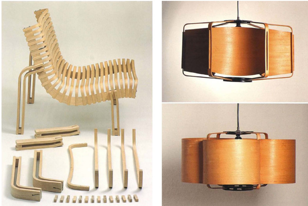
Figura 1. Izqda: Butaca de listones de madera curvada. Equipo 57. 1961. Dcha: Lámparas colgantes diseñadas por el Equipo 57 para Danona. 1962.

diseño del Colegio Oficial de Arquitectos de Andalucía Occidental en 1989, o el sillón M , seleccionado para la muestra Arquitectos andaluces, objetos cotidianos 19 que tuvo lugar en la galería Carmen de la Calle (Jerez) en 1997.