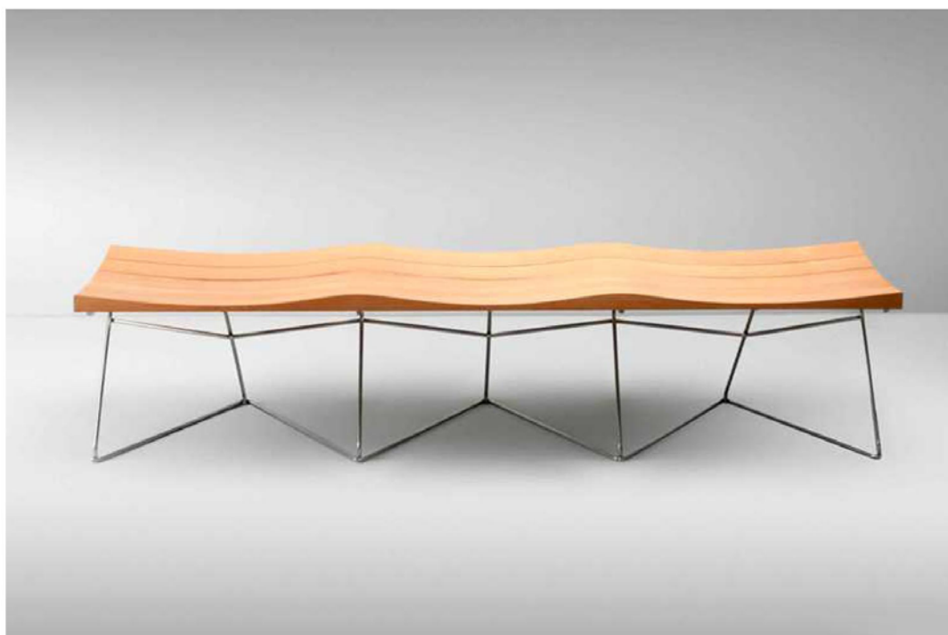
Figura 6. Superior: Bancada Secuencia C3A de Granada Barrero. 2019. Fuente: Pablo Ballesteros. Centro de Creación Contemporánea de Andalucía. Inferior: Banco Equipo 57. Fuente: Estudio Rafael Vargas. Museo del Diseño de Barcelona.