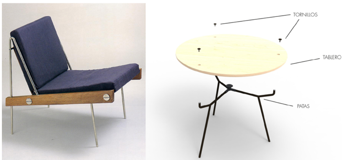
Figura 8. Izquierda. Sillón Córdoba del Equipo 57. 1959. Fuente: Catálogo de muebles años 50-60 COAM. Inferior. Modelado de la mesa Nonina de Irene Gallego. 2019. Fuente: Irene Gallego.