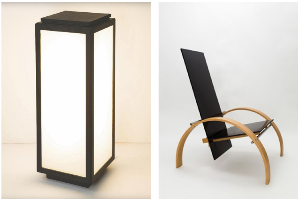
Figura 2. Izqda: Prototipo de farol para el Puente Romano, Córdoba. 2007. Autor: Pablo Duarte. Dcha: Sillón Inés diseñado por Juan Cuenca. Tirada de 50 uds. 1987. Autor desconocido.