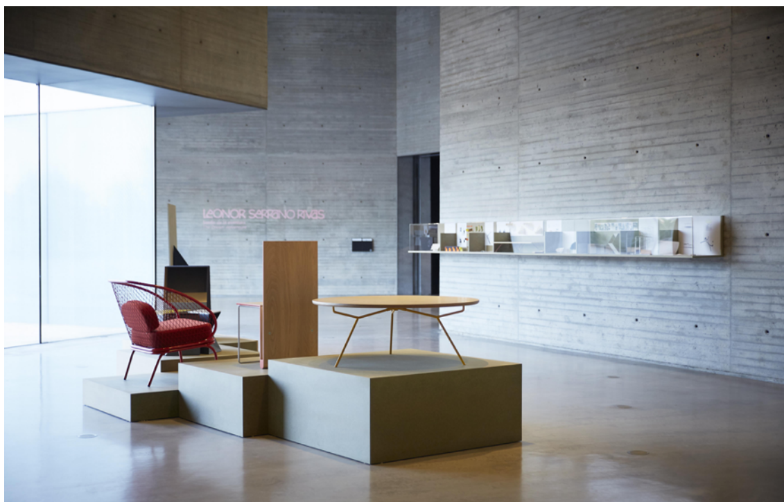
Figura 12. Imagen de la exposición Procesos sobre los resultados del Taller de Diseño de Mobiliario con Juan Cuenca. Fuente: Pablo Ballesteros. Centro de Creación Contemporánea de Andalucía

El 14 de mayo de 2019 fue inaugurada en el C3A la exposición de los resultados del Taller de Diseño de Mobiliario con Juan Cuenca que llevaría por título Procesos , haciendo alusión a lo verdaderamente importante de las enseñanzas de esta experiencia. Dicha exposición, con edición de catálogo, consistió en la muestra de los 10 prototipos finales y una gran vitrina de más de 10 metros de largo que albergaba el proceso de ideación y generación de cada uno de los muebles (Fig. 12).