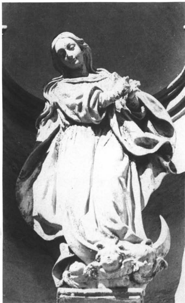
Lám. 3 Inmaculada Concepción. Escuelas Primarias. c/ San Luis (Sevilla). Portada.