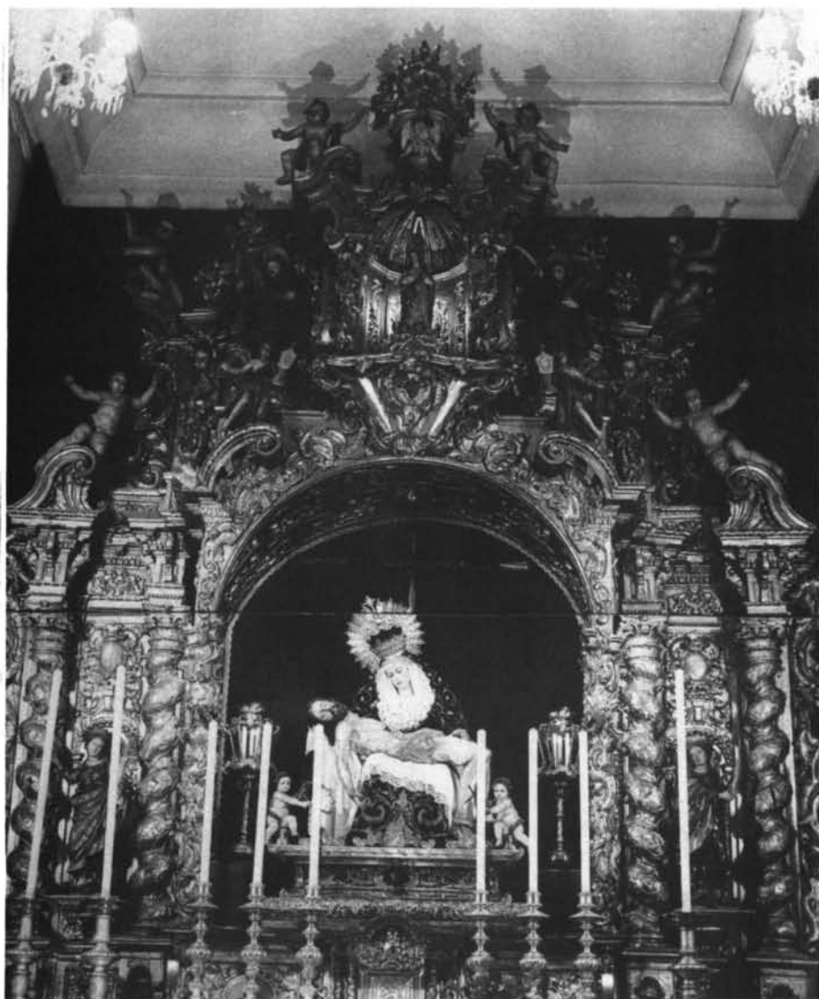
Lám. 2 Retablo de la Hermandad de los Servitas (Sevilla).