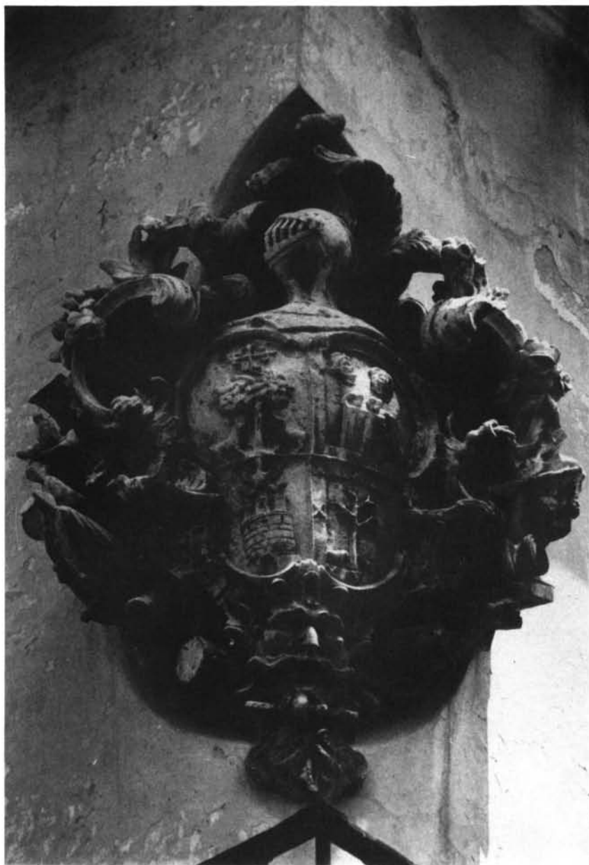
Lám. 1 Escudo heráldico. Palacio de los Pumarejo. Pz. del Pumarejo (Sevilla).