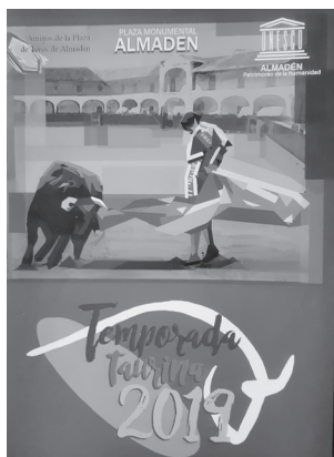
Fig. n.º 68.- Portada de la revista TOROS , de 20 de diciembre de 2019.