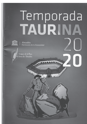
Fig. n.º 66.- Cubierta de la publicación anual editada por la Asociación de Amigos de la Plaza de Toros de Almadén (Ciudad Real) [APTA]. Temporada Taurina , 2020.