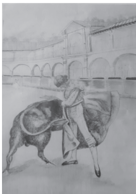
Fig. n.º 65.- Cartel de mano de la Feria Taurina de Almadén 2019.