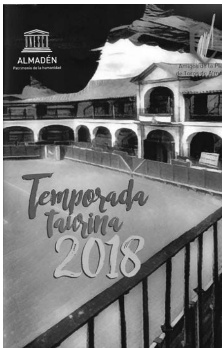
Fig. n.º 42.- Cubierta de la Publicación anual editada por la Asociación de Amigos de la Plaza de Toros de Almadén (Ciudad Real) [APTA]. Temporada Taurina 2018 .