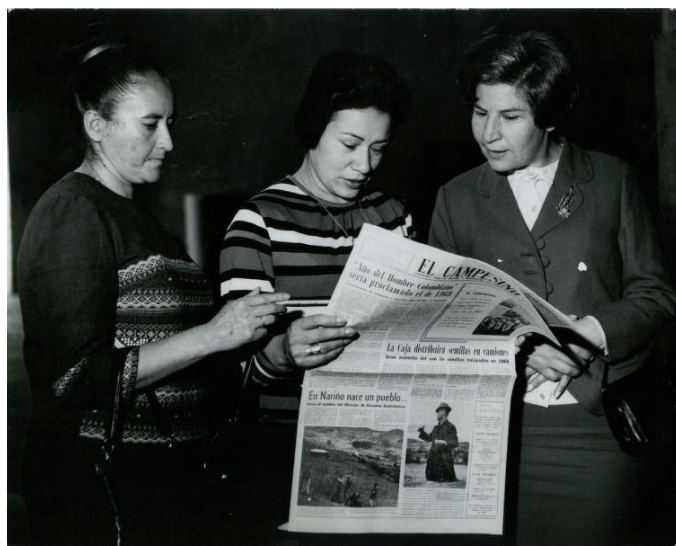
Digitizado por la Biblioteca Luis Ángel Arango del Banco de la República, Colombia.

Yo soy una campesina que me gusta trabajar, cultivando mi jardín para adornar el altar. En mi casa tengo huerta y también un buen jardín, todos los sábados vendo y tengo para mí vestir (El Campesino, 1959d).