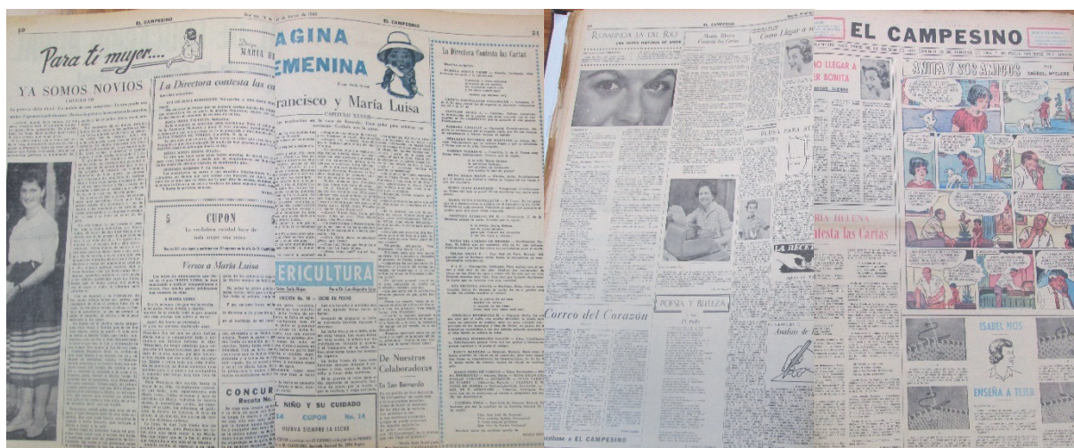
Imagen 1. Modelos presentación. Fuente: Semanario El Campesino 1959-1964, sección Para ti Mujer : a la izquierda, 14 junio de 1959 y 13 marzo de 1960; a la derecha, 4 de marzo de 1962 y 23 de enero 1964.

Este primer acercamiento con el público trajo consigo la implementación de algunas estrategias para el desarrollo de los contenidos que en el transcurso de las ediciones fueron adicionadas y cuya intención fue despertar la participación de las lectoras debido a la necesidad de amplificar el discurso diseñado por ACPO sobre la mujer campesina que consistió en un tipo de mujer desde dos ángulos: el primero residió en una transición entre ser analfabeta a vincularse a un entorno educacional y el segundo a la puesta en marcha los saberes aprendidos para ejercer los lineamientos de la institución en la comunidad como lideresa, empresaria, ejemplo de vida, madre cabeza de hogar, entre otras connotaciones. Vale la pena subrayar que esto no aplicó en todos los casos, porque simplemente no se adaptaron a dichos entornos.