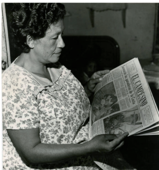
Digitizado por la Biblioteca Luis Ángel Arango del Banco de la República, Colombia.