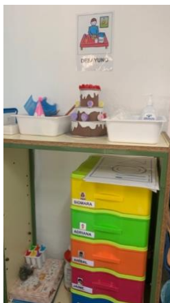
Figura 7 y 8. Zona de desayuno