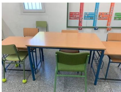
Figura 3. Trabajo con la seño.