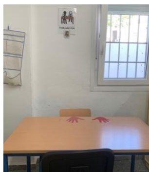
Figura 4. Trabajo con la seño Miriam.