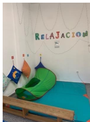
Figura 10. Zona de relajación.