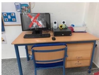
Figura 9. Zona de ordenadores.