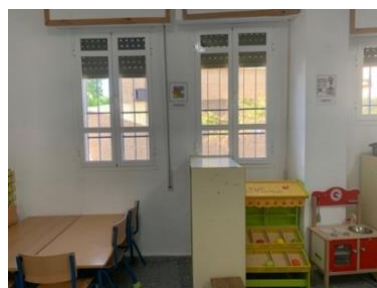
Figura 11. Zona de puzles y casitas.