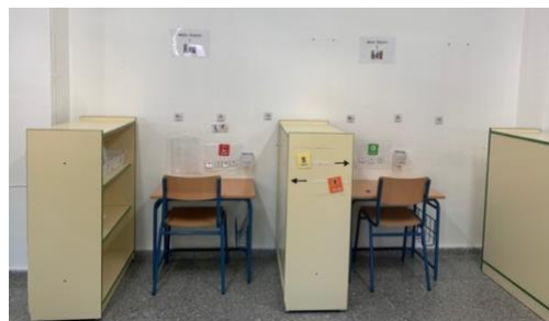
Figura 5. Zona de trabajo individual