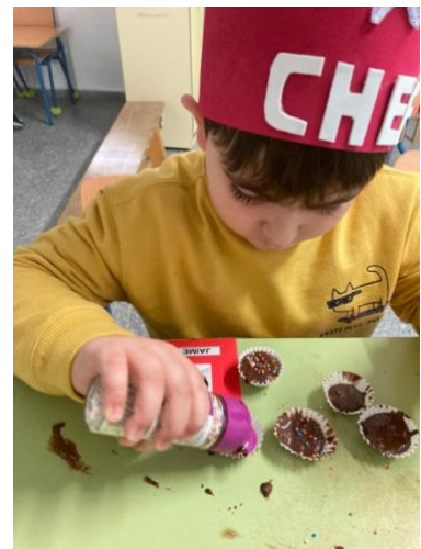
Tabla 10. Elaboración propia.