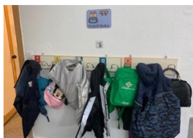
Figura 1. Zona de llegada.