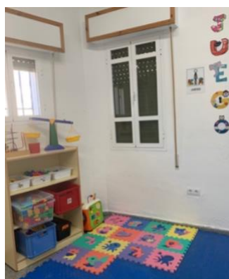
Figura 6. Zona de juegos