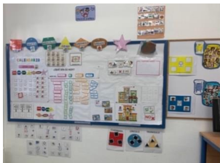
Figura 2. Zona de asamblea.