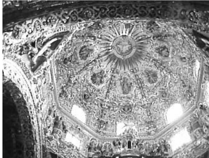
Figura 2: Capilla del Rosario (1680) revestida con dorados en Puebla. México.