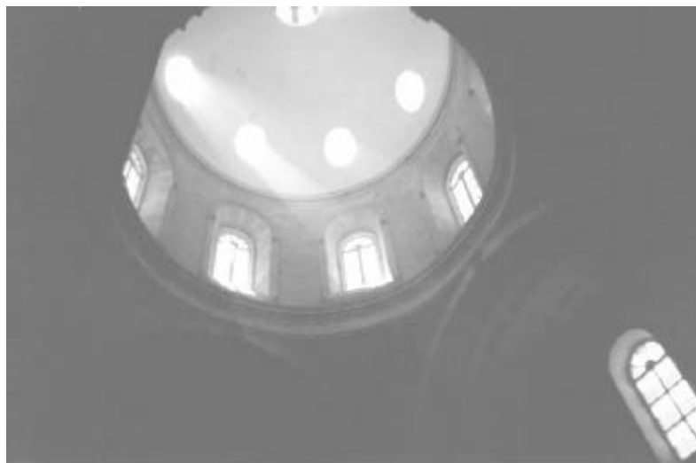
Figura 3: Interior de la Iglesia de São Bento (principios SXVIII).

A título de breves ejemplos, citaremos que en Brasil encontramos muchas referencias a lo anterior, un caso es la Iglesia de São Bento en San Salvador de Bahía, donde hemos observado que el arquitecto es capaz hasta de aumentar el tamaño y número de los huecos pero inmediatamente es consciente de la inutilidad del proceso por el incremento de radiación térmica que ello supone y que no se corresponde con una elevación del nivel de iluminación. Nos encontramos pues ante una frontera o límite emocionante para el diseño, si se crean más huecos el calor no es soportable, si menos, la luz resulta escasa.