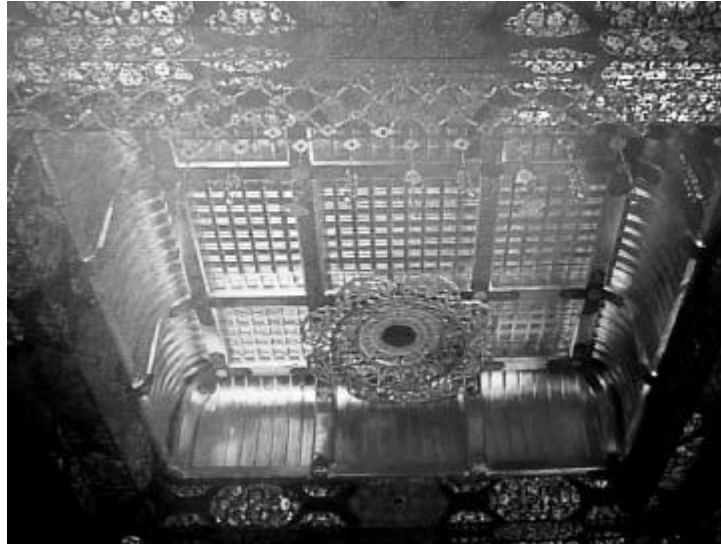
Figura 5: Vista interior del templo dorado de Chuson-ji (1126). Hiraizumi. Iwate. Japón.