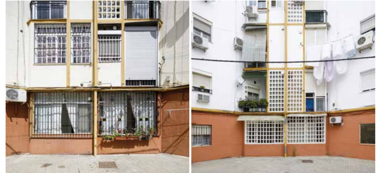
| Estado actual de las torres de la barriada Nuestra Señora del Carmen.

Como resultado, trabajar sobre el patrimonio arquitectónico y urbano del Movimiento Moderno nos enfrenta al reto de aunar preservación y habitabilidad, haciendo compatible la conservación de sus valores (materiales e inmaterial-