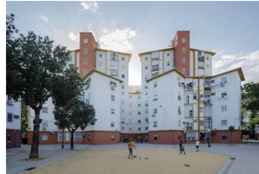
El Carmen en el paisaje histórico urbano de Sevilla.

Como propuesta de trabajo se establece una primera clasificación de los valores culturales de El Carmen agrupándolos en valores funcionales, estéticos,