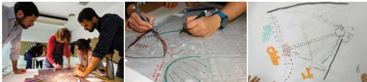
| Trabajo de grupo en el taller participativo. Actividad 1: definición de límites.