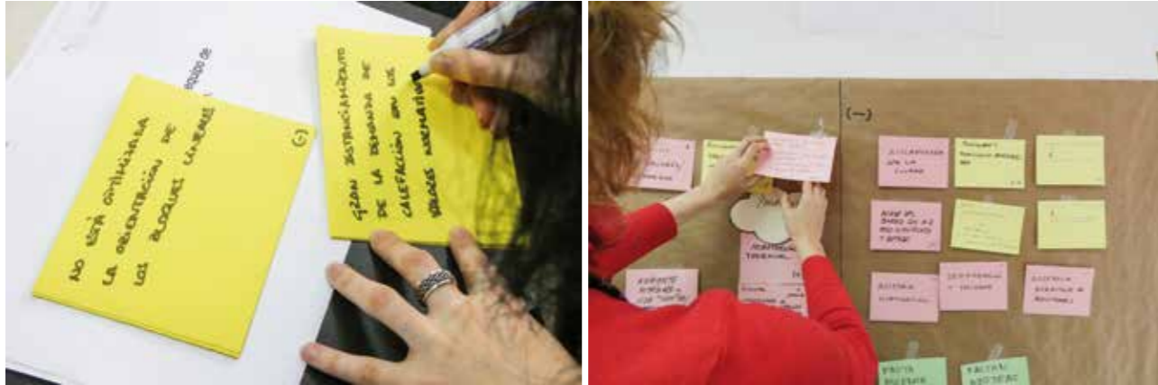
Trabajo de grupo en el taller participativo. Actividad 2: identificación de valores culturales.

esbozar (nuevas) representaciones (volver a hacer presente / hacernos cargo del proceso) que se construyen a través de la formulación de preguntas y la reflexión participada.