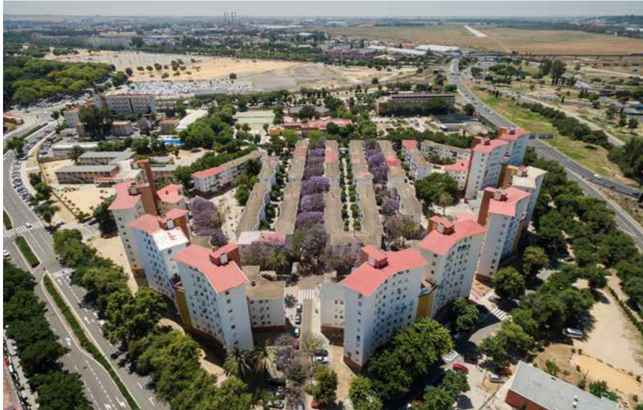
| Entorno urbano de la barriada Nuestra Señora del Carmen.

En consecuencia, trabajar sobre un sector de la ciudad, como es El Carmen, implica reconocerlo como parte funcional de un sistema complejo (en sus dimensiones material e inmaterial) proponiendo una estrategia de conocimiento adaptada a esta escala, que permita obtener un diagnóstico integral en el que basar las propuestas de intervención. En la búsqueda de la sostenibilidad urbana, estas propuestas estarán encaminadas a largo plazo a mejorar la habitabilidad, fomentar el desarrollo económico y la cohesión social.