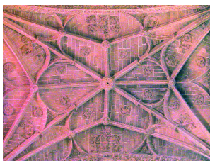
Bóveda de la nave central del crucero

La planta es rectangular con 3 naves de 5 tramos cubiertas con bóvedas de crucería sencilla que son estrelladas y profusamente decoradas, tanto en sus nervios como en la plementería, en los tramos correspondientes a la nave del crucero y a la cabecera. Igualmente destacan las bóvedas de la capilla bautismal y la de la capilla del Socorro.