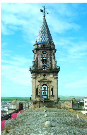
Vista de la cubierta de la nave central y torre

Ubicada en el arrabal histórico jerezano del mismo nombre, la Iglesia de San Miguel es obra de Diego Moreno Mélenlez, realizada entre los siglos XV y XVI, a caballo entre el Gótico más tardío y el primer Renacimiento. En su construcción se suceden los maestros mayores en activo en la Archidiócesis de Sevilla, desde Diego de Riaño que trabaja en el crucero, Martín de Gaínza que es el autor de las trazas de la sacristía y Hernán Ruiz II que remata la cúpula de dicha estancia.