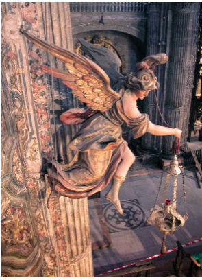
Ángel lamparero de la Parroquia del Salvador