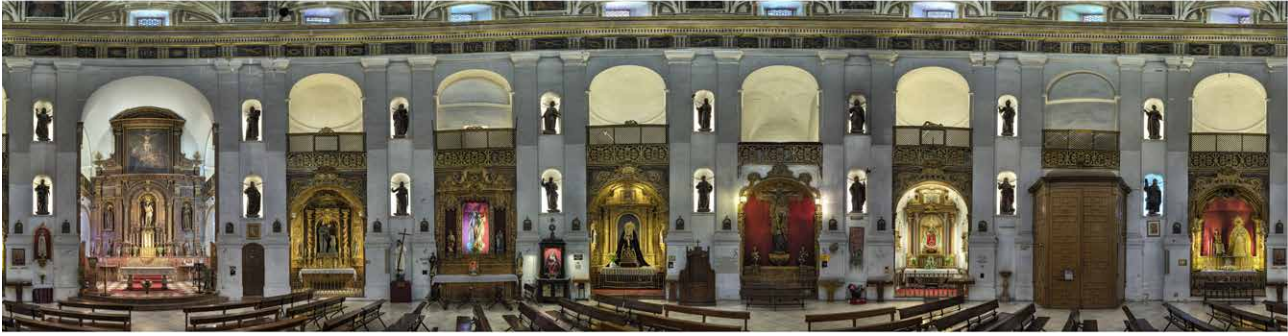
Estado previo a la intervención: alzado desarrollado de la base de la cúpula entendido como un plano continuo que se despliega, alojando a capillas y con referencias a los ejes compositivos de la planta centralizada.

sustanciales, históricamente determinadas: del original hasta el estado actual, como resultado de las varias transformaciones que han ocurrido en el tiempo, y de las que están por venir. Para ello, se trabajó con cuestiones que ya habían quedado definidas en la Carta de Brasilia de 1995 en la que la autenticidad, o las autenticidades de un bien, tiene que ver con la identidad, el mensaje, el contexto y la materialidad. Y por otro lado, bajo las premisas de mínima intervención y actuación justificada.