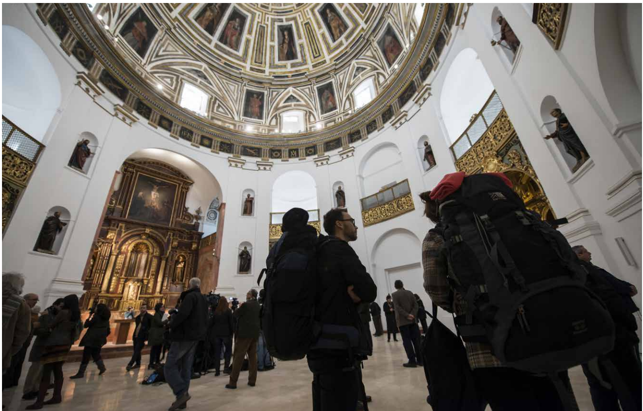
Presentación de la intervención en la iglesia del Santo Cristo de la Salud de Málaga, enero de 2015. El Patrimonio es el mensaje, el patrimonio es un ejercicio de transferencia en sí mismo.

Los criterios de intervención se basan en la consideración de la autenticidad 4 del bien cultural tal y como la define la Carta de Cracovia, significa la suma de características