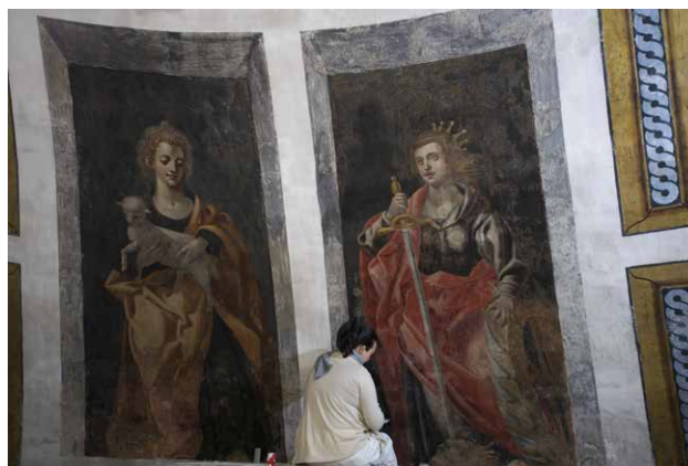
Imágenes del proceso de restauración de la pintura mural.