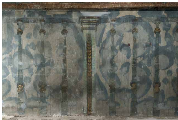
Detalles de la celosía y la pintura de los pretiles de las tribunas.