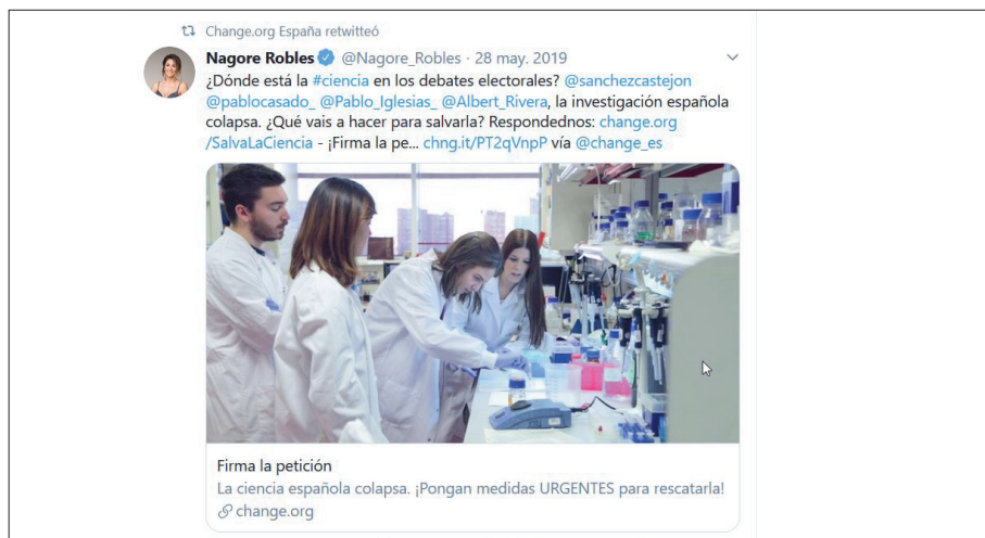
Fig. 5: Componente icónico de la petición disponible en: < https://bit.ly/37Sg1i >. [Última consulta: 08/01/2020].

Y es que resulta habitual que las peticiones sean distribuidas a través de esta red social, con el fin de otorgarles una mayor difusión: