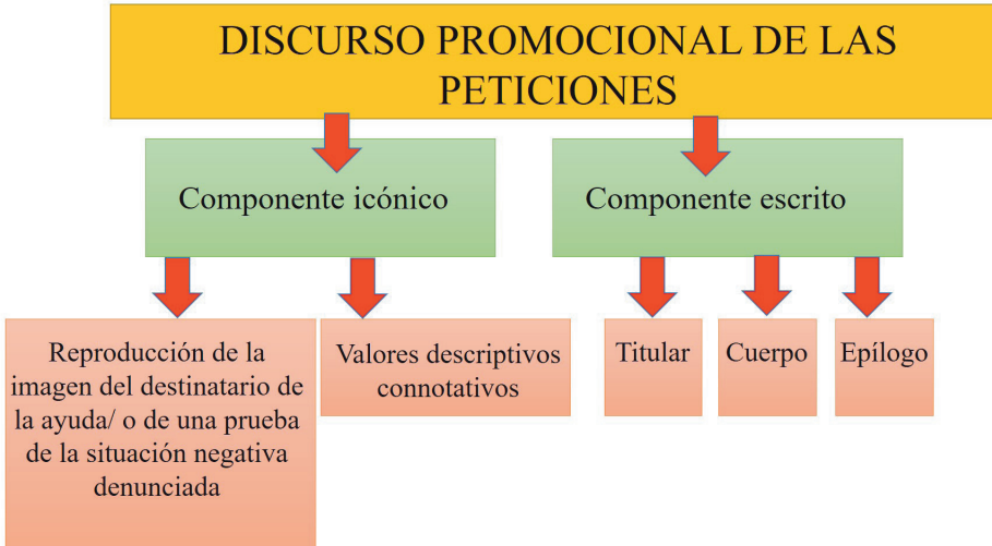
FIG. 2: Representación de la superestructura de la mayoría de las peticiones analizadas.

Y la superestructura de la mayor parte de las peticiones que conforman nuestro corpus podría representarse de manera muy similar: