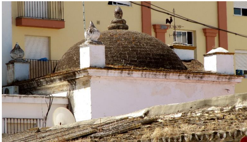
fig. 7. Capilla del Calvario, engullida en modernas construcciones.

anexa, que luego pasó a la Orden Tercera, hacia 1714. 55 Es de planta cuadrada y fábrica de ladrillo enfoscado y encalado, con bóveda de media naranja trasdosada. 56 (Fig. 7)