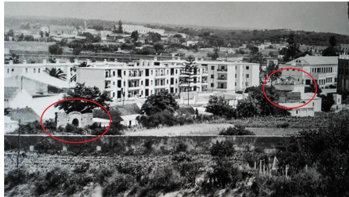
fig. 8. Detalle de una postal fotográfica de Sanlúcar de Barrameda. Década de 1950. Se observan restos de una potente puerta que parece corresponder al convento franciscano.

Carlos V y los franciscanos en tránsito al Nuevo Mundo. El convento sanluqueño de Santa María de Jesús.