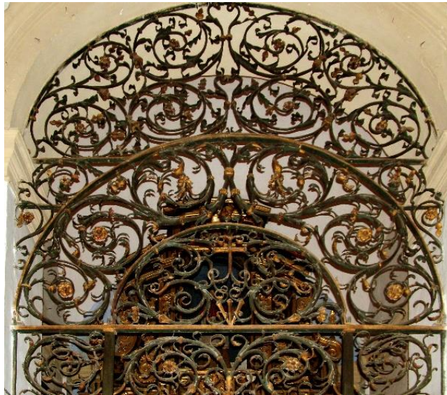
fig. 2. Reja de hierro de la capilla de las Cinco Llagas-, actualmente en la iglesia de San Francisco “el Nuevo” de Sanlúcar de Barrameda.

Carlos V y los franciscanos en tránsito al Nuevo Mundo. El convento sanluqueño de Santa María de Jesús.