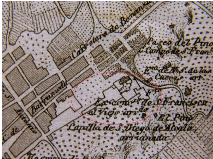
fig. 5. Detalle del plano de Sanlúcar de Barrameda incluido en el Atlas de España y sus Posesiones de Ultramar , de Francisco Coello, de 1868, que recoge la ubicación del convento de San Francisco “el Viejo”.

Carlos V y los franciscanos en tránsito al Nuevo Mundo. El convento sanluqueño de Santa María de Jesús.