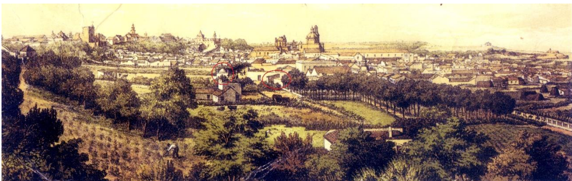
fig. 6. Detalle de una vista de Sanlúcar de Barrameda desde El Picacho, que se recoge en una litografía del siglo XVIII o principios del XIX, donde se observa la capilla del Calvario y los restos del convento de San Francisco “el Viejo”.

De gran calidad visual resulta una litografía de finales del siglo XVIII o principios del XIX, donde se observa lo que restaba del edificio, como algunos muros de tapia e intacta la capilla del Calvario. (Fig. 6)