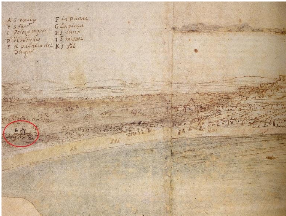
fig. 4. Anton Van den Wyngaerde. Detalle de la Vista de Sanlúcar, 1567, con el convento franciscano marcado con la letra B. Ashmolean Museum, Oxford.

Carlos V y los franciscanos en tránsito al Nuevo Mundo. El convento sanluqueño de Santa María de Jesús.