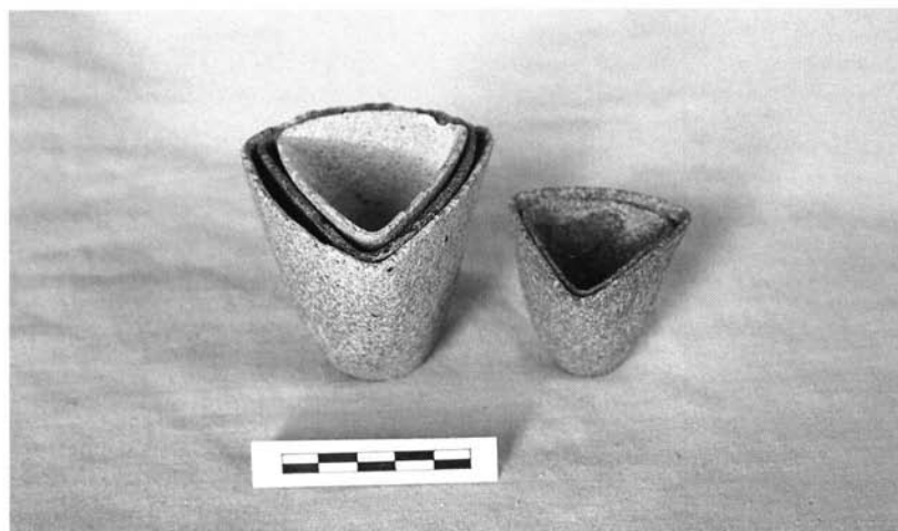
Lám. 2. Encaje de 4 crisoles.