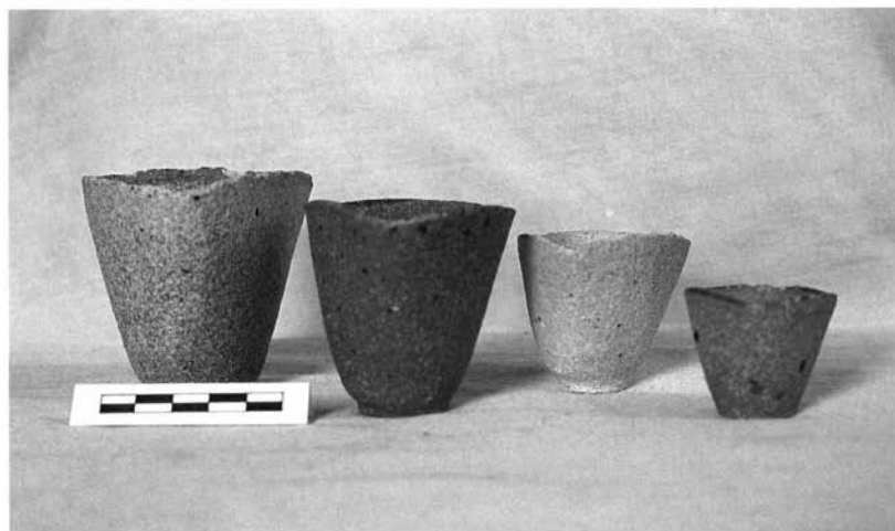
Lám. 1. Conjunto de crisoles de Sanlúcar.