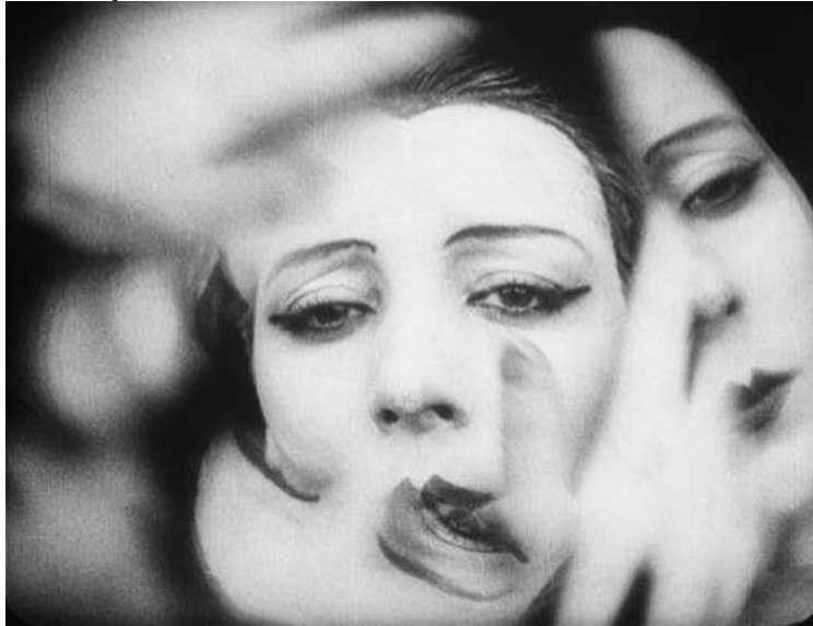
Figura 3. Fotograma de Jeux des Reflets et de la Vitesse .