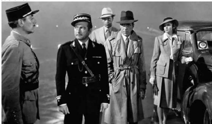
Figura 7. Fotograma de Casablanca .