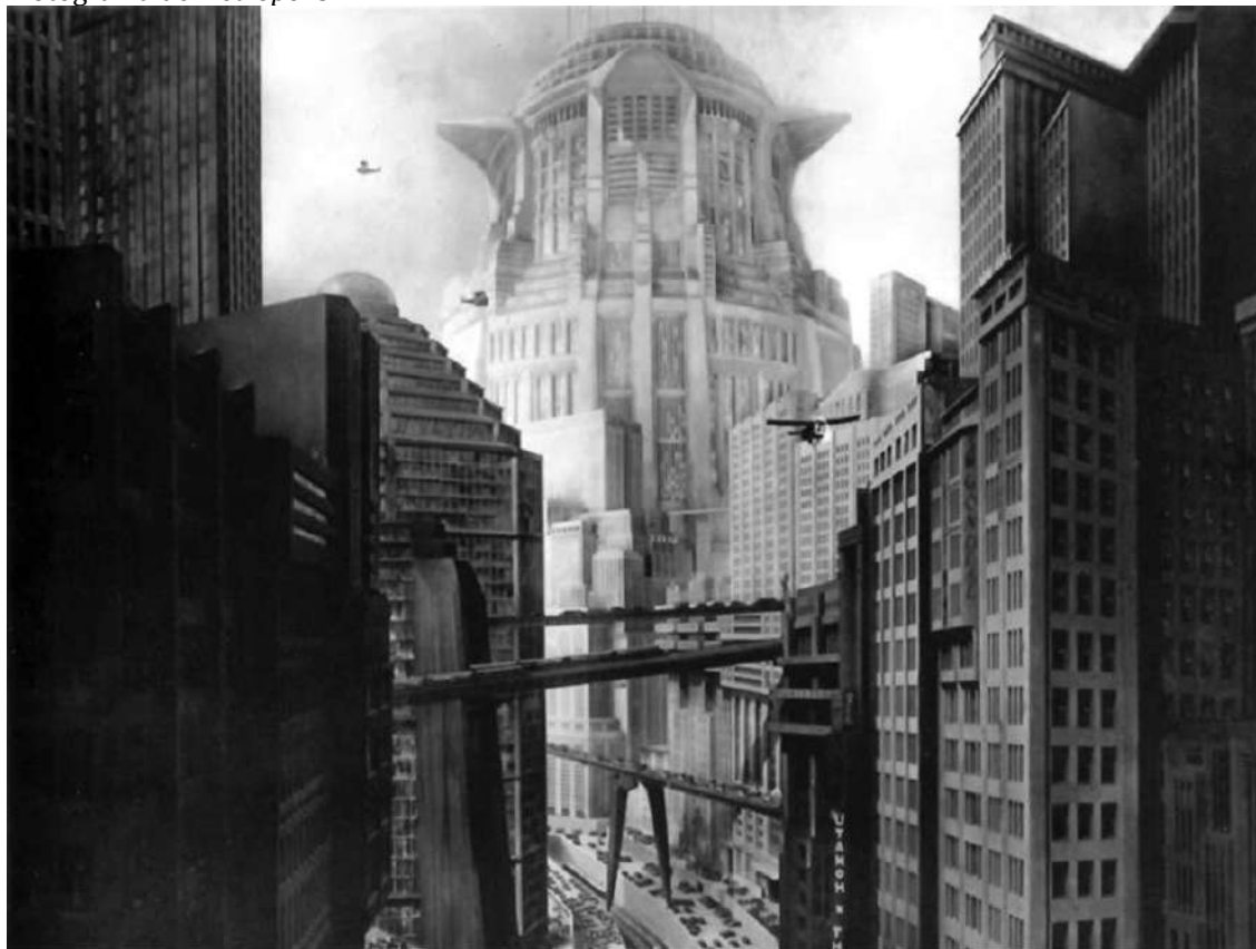
Figura 4. Fotograma de Metrópolis .