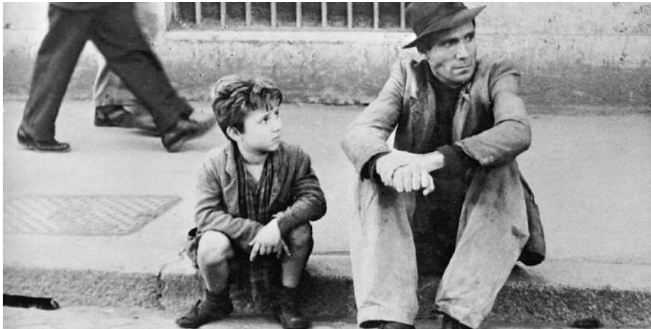
Figura 9. Fotograma de Ladrón de bicicletas .

El neorrealismo italiano nace en la postguerra de la Segunda Guerra Mundial, una guerra que pierden las potencias del eje: Alemania, Japón y la Italia de Mussolini. A diferencia del nazismo, el fascismo italiano no es vencido exclusivamente en territorio europeo por los aliados, sino que es derrocado en parte por la propia reacción interna de los partisanos. Así, la Italia de la postguerra no puede entenderse sin el motor cultural que supusieron los partisanos y su visión de una izquierda independiente de Moscú (y que, décadas más tarde, acabaría fraguando en el concepto de Eurocomunismo con el PCI —Partido Comunista Italiano—, el más grande de Europa, como muñidor). Su movimiento cultural, por tanto, ve en el cine y en la fotografía una gran cadena de transmisión de valores partisanos, basado en historias realistas, mínimas, rodadas en exteriores y protagonizadas muchas veces por actores no profesionales pertenecientes a la clase obrera de la sociedad, trabajadores o personas pobres (Brunetta, 2008).