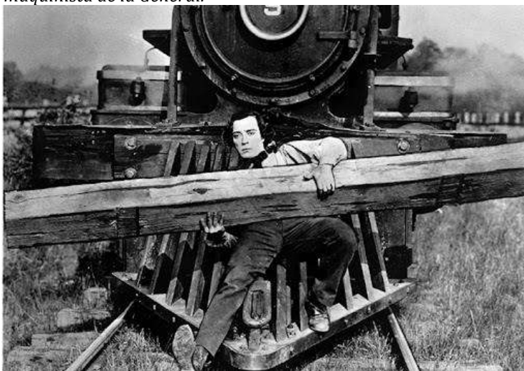
Figura 2. Fotograma de El maquinista de la General .

Los dos cómicos que importarán el oficio de hacer reír en la pantalla del cine serán Charles Chaplin alias “Charlot” y Joseph Frank “Buster” Keaton conocido en España como “Pamplinas” o “Cara de palo”, una especie de bohemios geniales, divertidos y, a la vez, críticos con su sociedad industrializada y deshumanizada por el gran capital. Sus gags son aún hoy famosos y se consideran ya integrantes de la cultura popular del s. XX: Charlot protagoniza La Quimera del Oro (1925) y de Buster Keaton El maquinista de la General (1926).