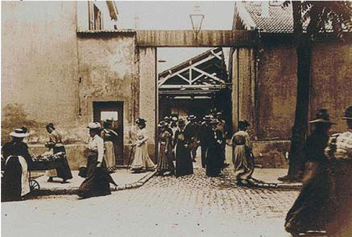
Figura 1. Fotograma de Salida de la fábrica .

—dada la persistencia retiniana que es la base de la ficción motora— típicas de las barracas de las ferias, compartiendo vecindad de caseta con la mujer barbuda o el hombre bala.