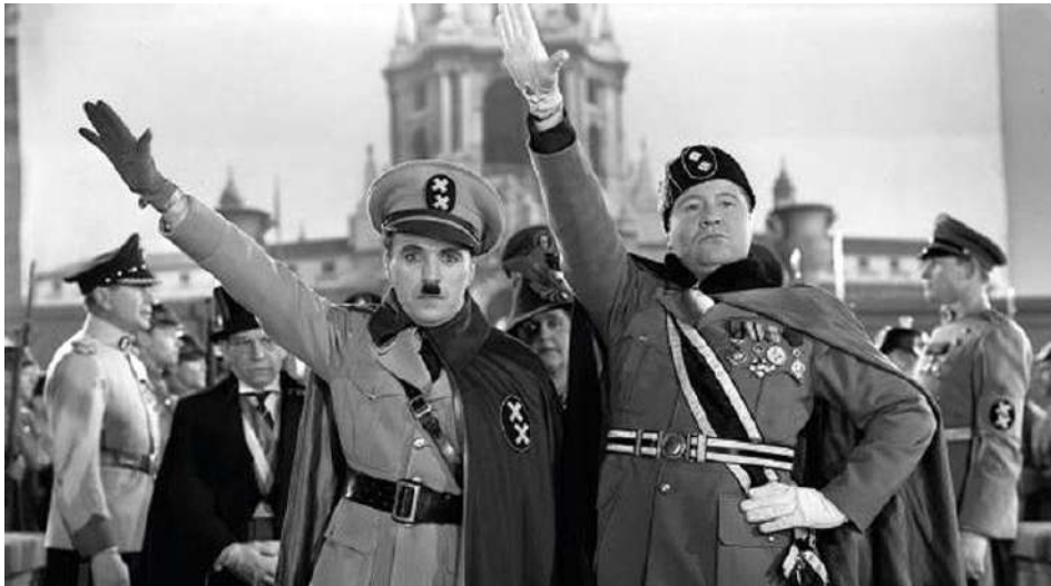
Figura 6. Fotograma de El Gran Dictador .