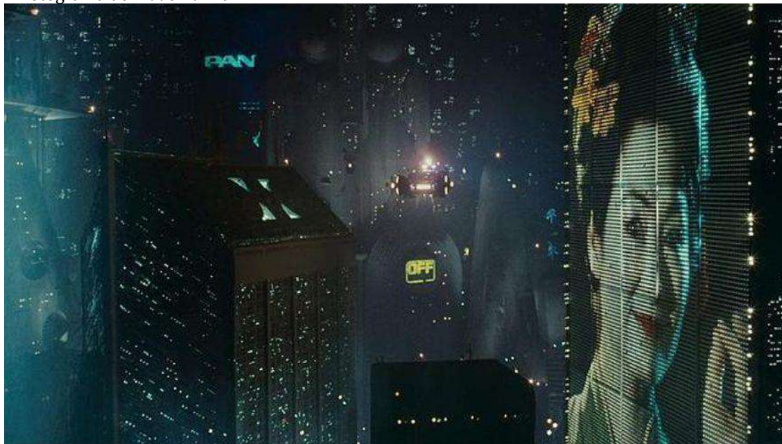
Figura 11. Fotograma de Blade Runner .

La ciudad presentada, Los Ángeles, está ambientada en el por entonces lejano y distópico año 2019 y se nos muestra como una colmena anonimizada y dependiente de la tecnología, donde la humanidad y la robotización son indistinguibles y ambas están supeditadas a la lluviosa y mortecina urbe como estructura. Esa visión es, de algún modo, imperante en las películas de ciencia ficción, cuya influencia sigue dominando la cartelera hoy día.