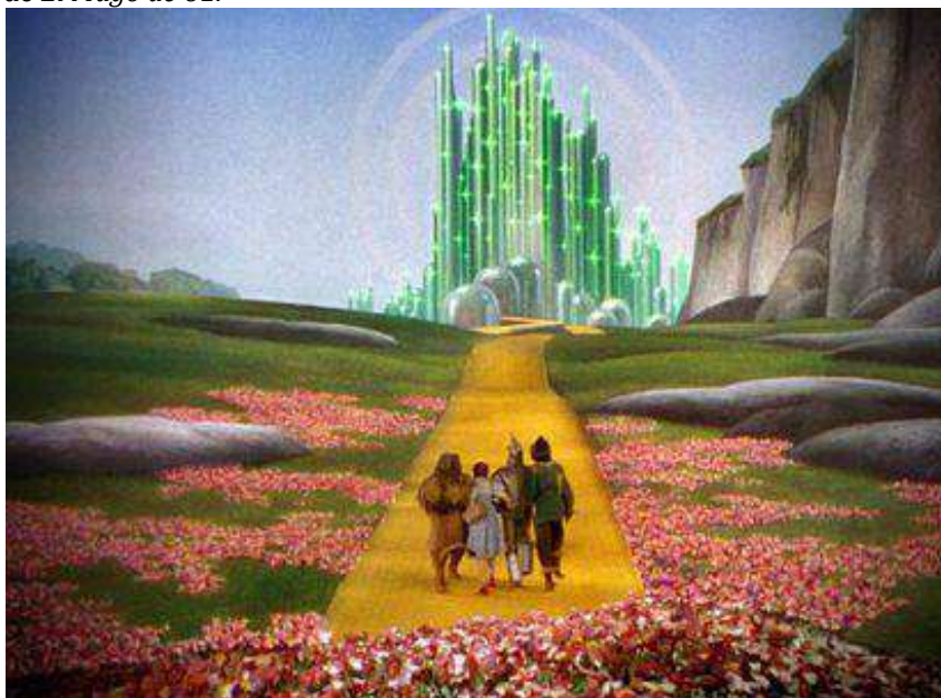
Figura 8. Fotograma de El Mago de Oz .

La trama se sucede en ciudades a veces fantásticas e imaginarias propias de la ensoñación ( El mago de Oz ) donde se proyectan buena parte de las ansias de la construcción de una nueva sociedad.