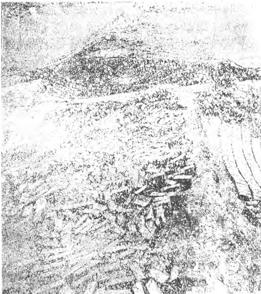
Anselm Kiefer, pintura, 1997.