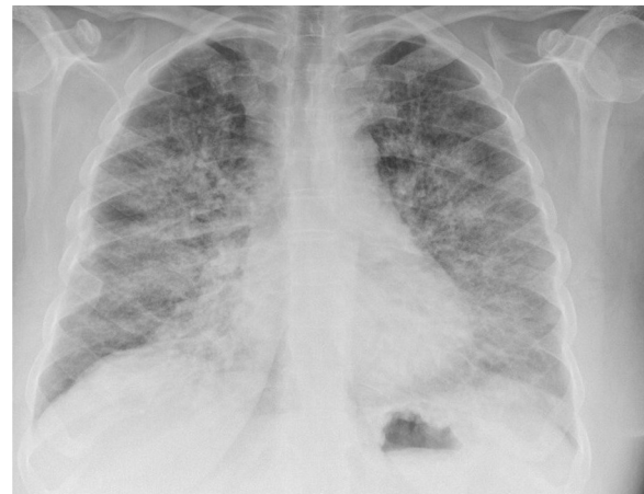
Figura 1 Radiografía de tórax: ICT normal. Infiltrado alveolo-intersticial bilateral de predominio en base derecha de cronología aguda.

Vuelve a consultar por empeoramiento de su disnea habitual de un día de evolución. Dicho cuadro aparece después de mezclar varios productos de limpieza (refiere combinar en un cubo lejía, amoníaco, en menor cuantía sulfamán [ácido clorhídrico] y otros productos químicos) con objeto de desinfectar las paredes y superficies de su domicilio). Se justifica explicando que, en las noticias, de forma continua se indicaba la necesidad de desinfectar las superficies para prevenir el coronavirus. La paciente ha realizado esta mezcla sin airear su domicilio, manteniéndolo cerrado durante el proceso de desinfección (según nos indica ha desinfectado su casa en otras ocasiones, con los mismos químicos, mejorando su ansiedad al contagio). No obstante, en el momento actual, se ha visto que la desinfección de superficies no es un elemento primordial para la prevención de la COVID-19, sin embargo, la aireación de las superficies si es un elemento cardinal para su prevención 3 .