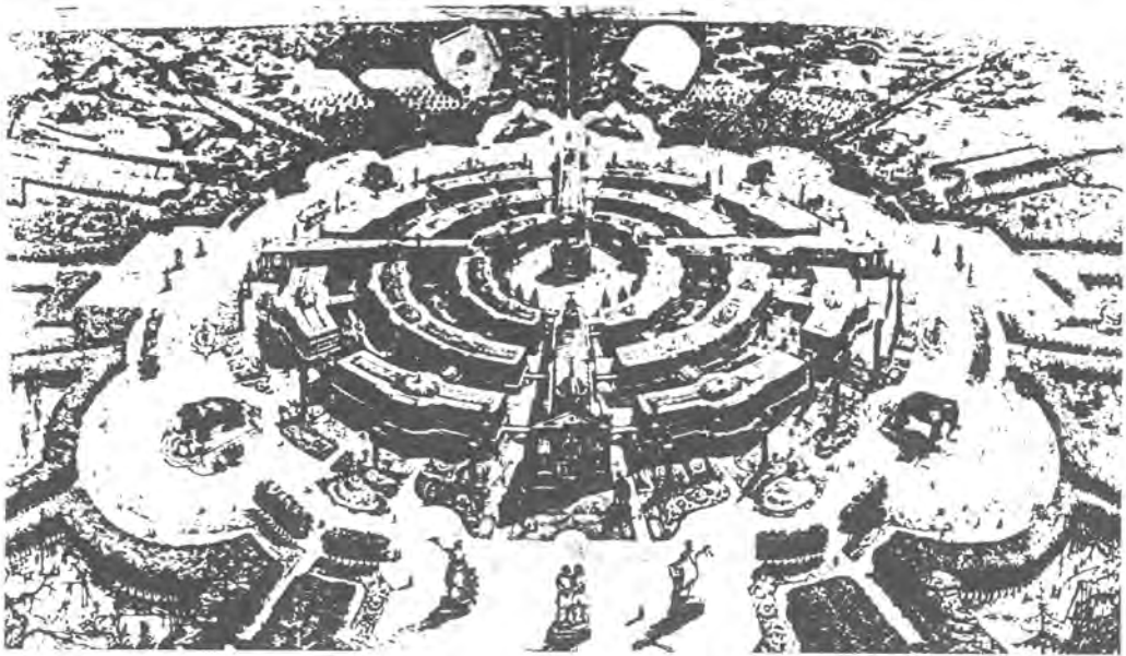
André: proyecto para una comunidad ideal, hacia mediados del siglo XIX