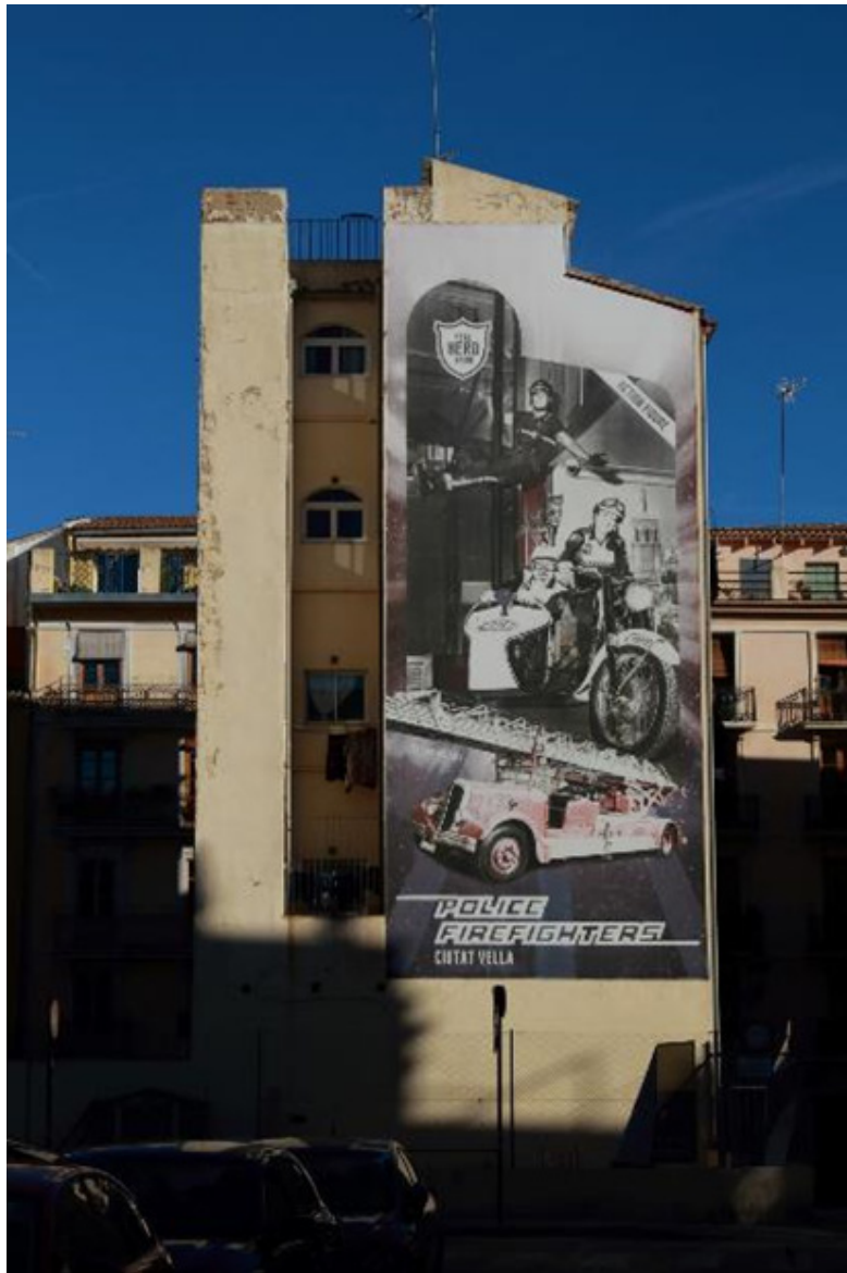
Figura 2 Street art con aroma anglosajón (Valencia)

incorpora a un sistema local de voces en forma de red que explica los procesos que afectan a las diferentes zonas urbanas.