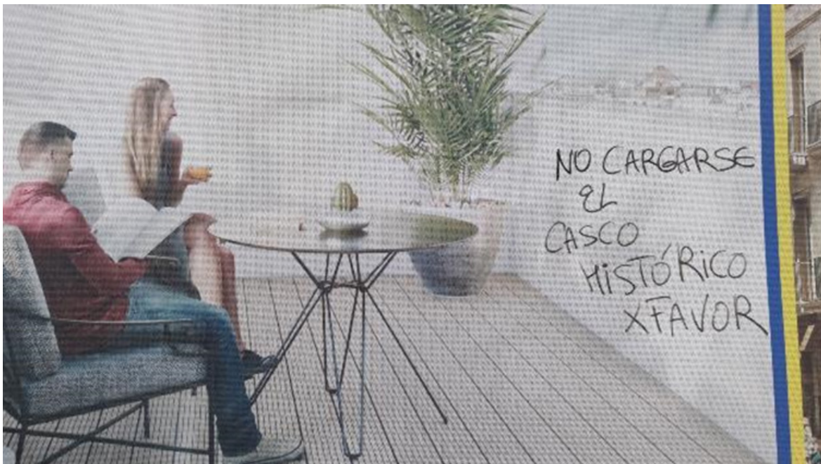
Figura 6 El casco histórico no (Cádiz)