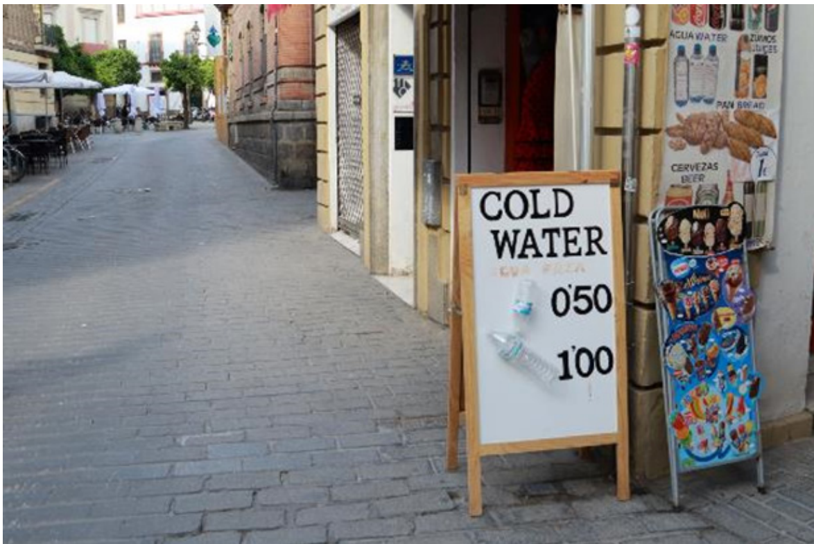
Figura 1 El turismo habla inglés (Sevilla)

Interesa, a la inversa, cualquier mensaje o vía de comunicación que permita vislumbrar de forma directa o indirecta, a través del micropaisaje que genera, el sentir de la población local frente al proceso globalizador de la actividad turística. Se trata en la mayor parte de los casos de reclamos negativos que, con mayor o menor crudeza, exponen la queja vecinal. ¿Cómo se presentan materialmente estas quejas?