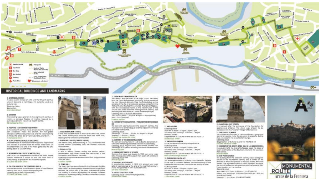
Figura 3.4 Ruta Monumental Arcos de la Frontera.

Esta ruta es una manera de influir en elementos tan importantes en la gestión de un destino como la distribución de los canales de entrada de los turistas y la promoción de los monumentos locales.