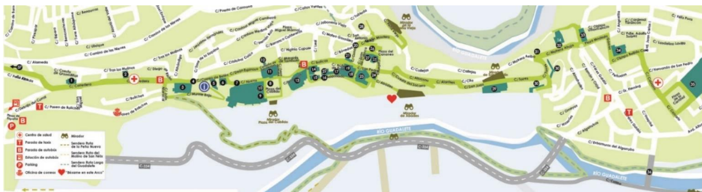
Figura 4.3: Mapa Zona Monumental Casco Histórico.

Todo esto, aunque podría causar ciertas reticencias para una parte de la población, se podría realizar teniendo en cuenta sus aportaciones, a través de mecanismos como la mesa de turismo del municipio, y tomándose como modelo la implantación de la peatonalización en otras localidades, para tener un marco de referencia.