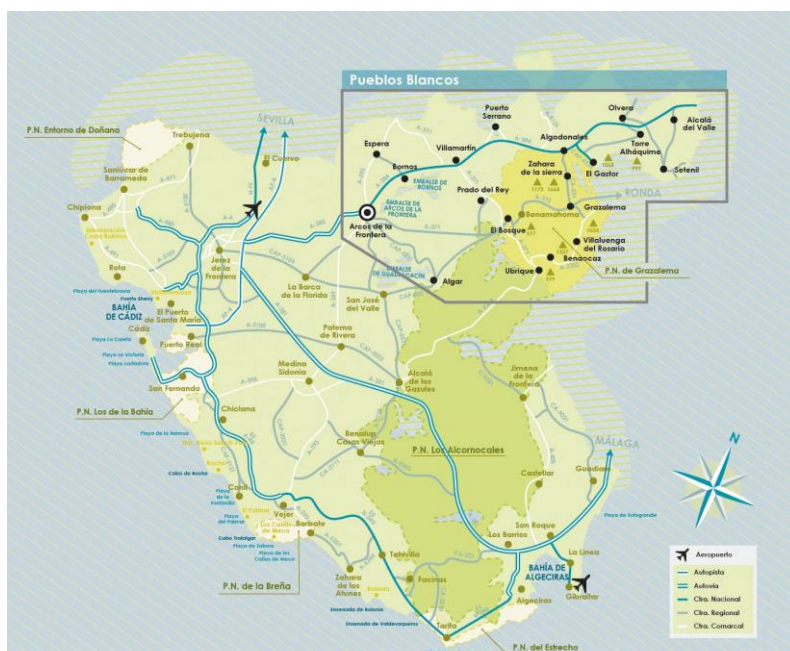
Figura 3.2: Mapa ruta pueblos blancos.

Dicha ruta ha sido publicitada a nivel nacional e internacional por medios como Televisión Española, la Junta de Andalucía, el periódico The Guardian, el País, la Razón o Europapress, lo que denota su gran interés turístico y la cantidad de turistas que atrae a esta región, beneficiando a todas sus localidades desde el punto de vista económico, cultural y por supuesto, turístico.