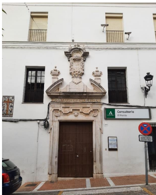
Figura 2.3: Portal del Pósito.

No tiene régimen de protección especial, pero al ser de titularidad pública recibe un mantenimiento regular y está en muy buen estado de conservación. No se realiza conteo de visitantes al ser únicamente observado su exterior desde la calle Corredera. (Ayuntamiento de Arcos de la Frontera, Consejería de Turismo s.f.).