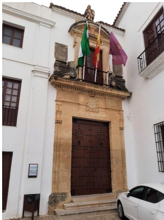
Figura 2.5: Portal del Ayuntamiento.

En cuanto al régimen de protección, ni el ayuntamiento ni la plaza están declarados BIC en sí mismos pero sí cuando son considerados como parte del conjunto histórico. Se podría decir con cierta certeza que una inmensa mayoría de los turistas que visitan la localidad visitan esta zona, que es una parada obligatoria en todos los tours y rutas culturales disponibles.