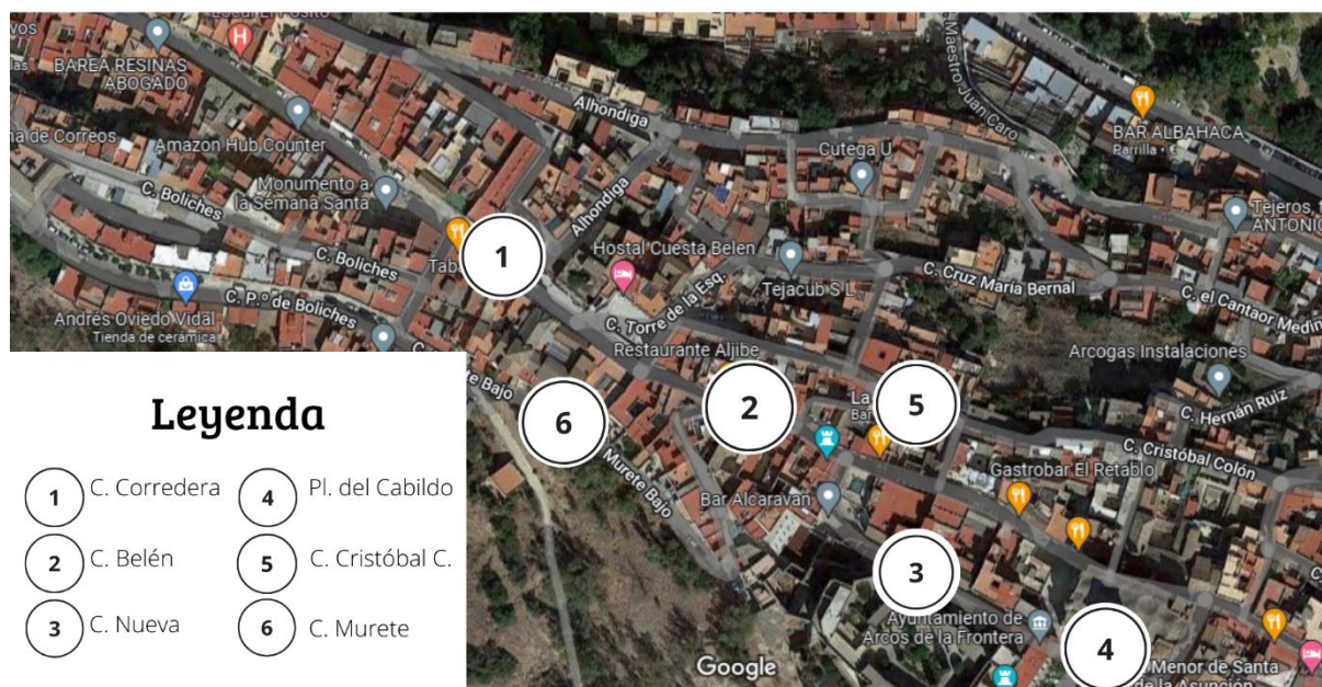
Figura 4.2: Mapa Señalización.