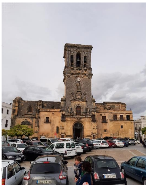
Figura 2.8: Basílica Menor de Sta. María.

Fue declarada Monumento Nacional en 1931, Basílica Menor en 1993, y está inscrita como bien de interés cultural BIC, al ser de carácter religioso, es propiedad privada y su gestión turística, entradas y visitas están a cargo de la propia iglesia.