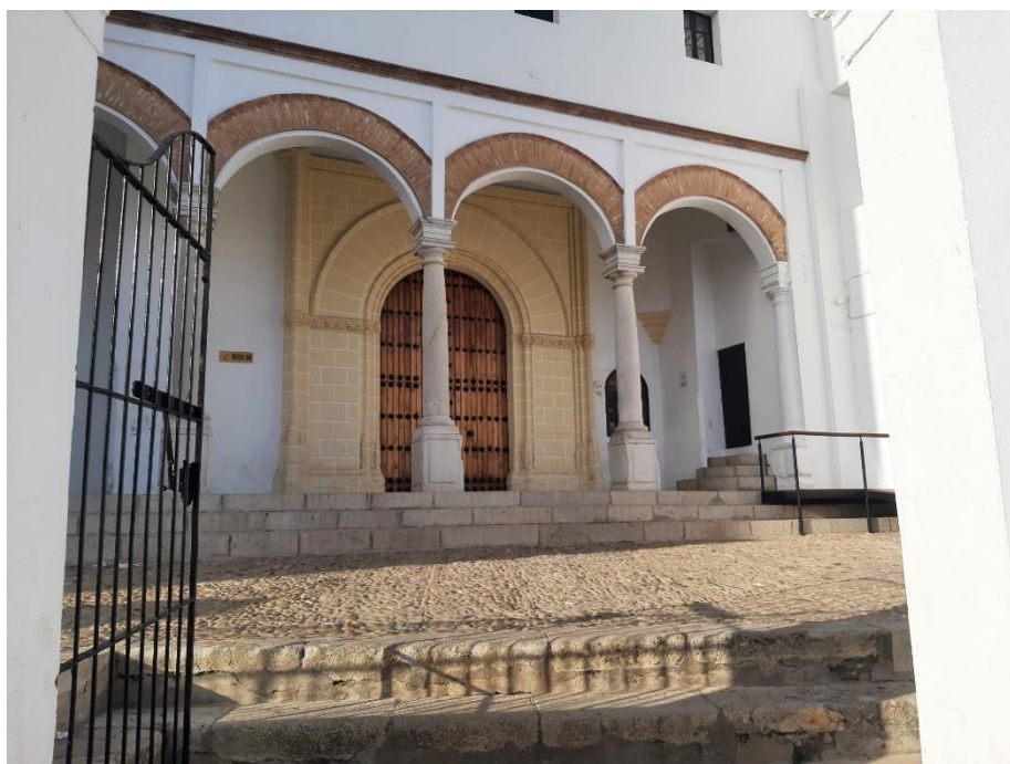
Figura 2.10 Portal parroquia de San Francisco.

Al no ser propiedad pública, es gestionada por la propia iglesia, al igual que las parroquias mencionadas con anterioridad.