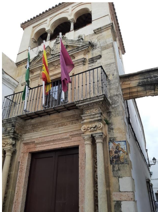
Figura 2.4: Palacio del Mayorazgo.

No tiene ningún régimen de protección destacable y aunque no se encuentran disponibles los datos exactos acerca del número de turistas que visita el monumento, se conoce que es uno de los más visitados.