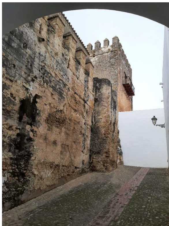
Figura 2.6: Portal del Castillo.

Aunque es propiedad privada, actualmente perteneciente a una familia de ascendencia inglesa, y es, por tanto, difícil de gestionar desde el punto de vista turístico, el ayuntamiento de la localidad llegó en 2014 a un acuerdo a través del cual se permiten entre cuatro y cinco días de visita turística anuales, en grupos limitados (acoge aproximadamente a unos 10-15 visitantes por grupo), para todo el colectivo que pueda estar interesado. Dichas visitas se continúan haciendo todos los años desde la firma de dicho acuerdo y permiten ver ciertas partes del castillo como el patio de Armas o una balconada con vistas a la peña. (Armario, 2014).