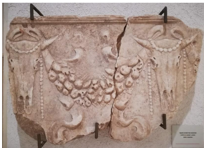
Figura 2.2 Relieve romano con guirnaldas y bucráneo.

Otros vestigios Romanos hallados inicialmente en el término municipal de Arcos de la Frontera, aunque expuestos actualmente en el museo de la ciudad de Cádiz, son un conjunto de relieves que representan bucráneos y guirnaldas (Fig. 2.2), fechados del siglo III y realizados en mármol. (de la Sierra, 2018:2)