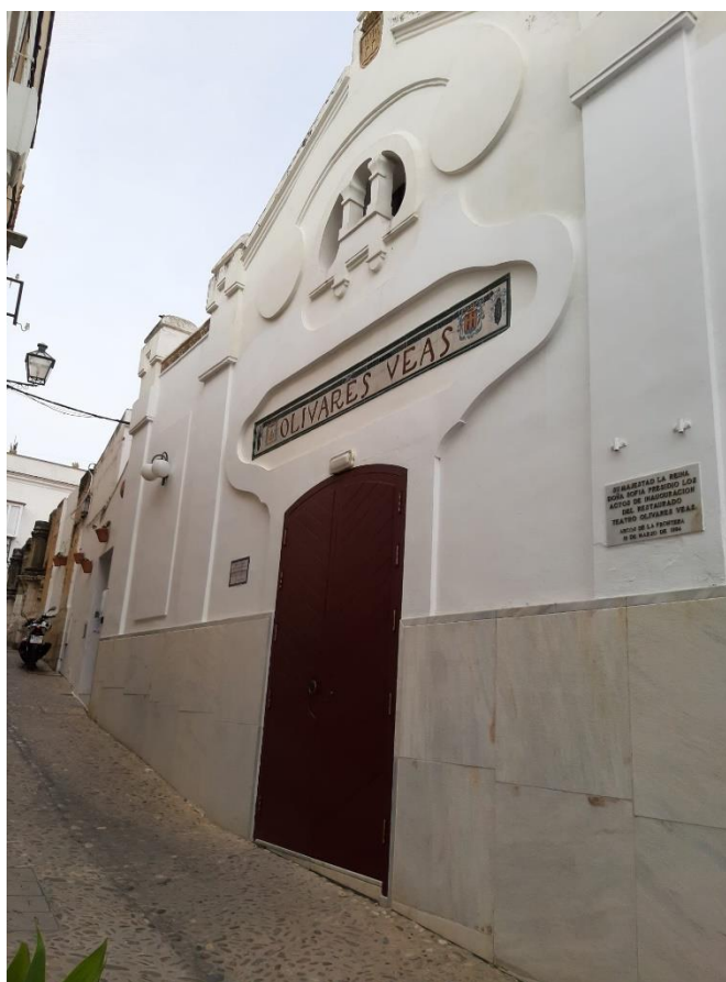
Figura 2.11: Exterior teatro Olivares Veas.

Cuenta con un aforo de 223 personas, es de propiedad pública (Municipal) y gestionado por el ayuntamiento, siendo utilizado para muchos eventos de interés cultural a nivel local, no tiene régimen de protección específico y al ser un teatro pequeño, no atrae tantos turistas ni visitantes como otras manifestaciones del patrimonio local.