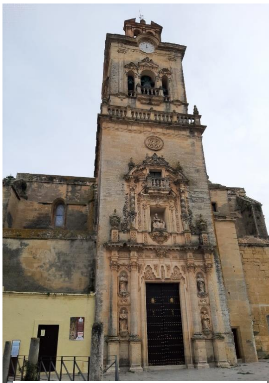
Figura 2.9: Iglesia de San Pedro.

Al igual que la iglesia de Santa María, es propiedad privada y los horarios de visita y otros elementos de interés turístico como el precio por entrada son gestionados por la iglesia, aunque no está declarada de interés cultural.