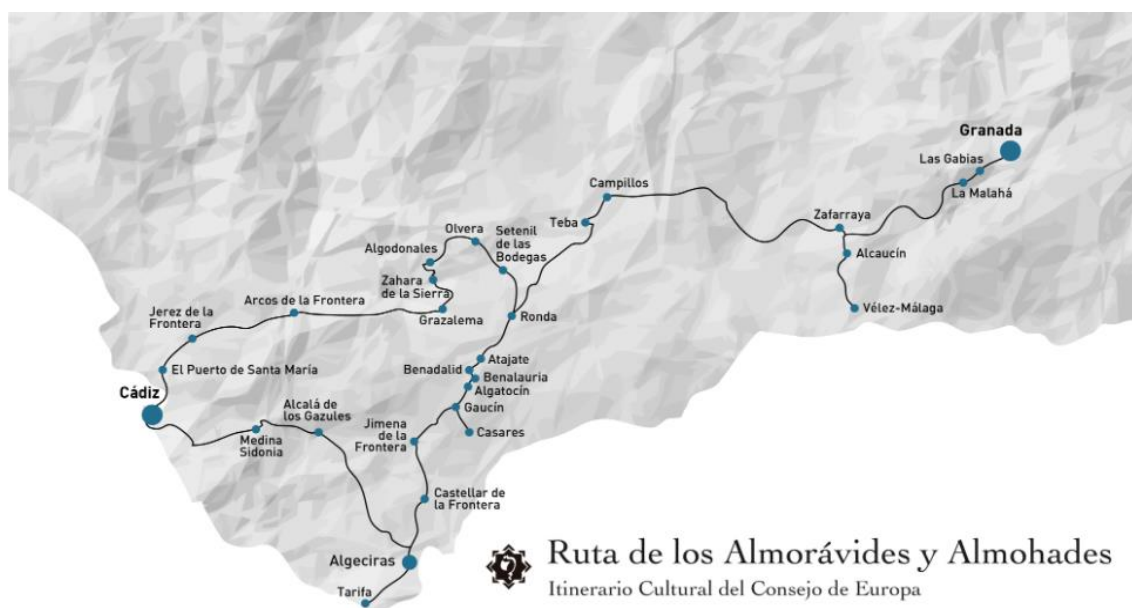
Figura 3.3 Ruta de los Almorávides y Almohades.

Su origen histórico está en Al-Ándalus y las relaciones entre el norte de África y la península ibérica, que tuvieron lugar desde el siglo VIII d.C hasta 1492 cuando terminó su estancia en la península con la capitulación de Granada. En estos casi ocho siglos de historia, estos pueblos introdujeron en el territorio sus manifestaciones artísticas, lenguaje, gastronomía y cultura en general, que dejaron su huella en estas localidades que comparten una historia y modo de vida común (Olmedo, F, 2006).