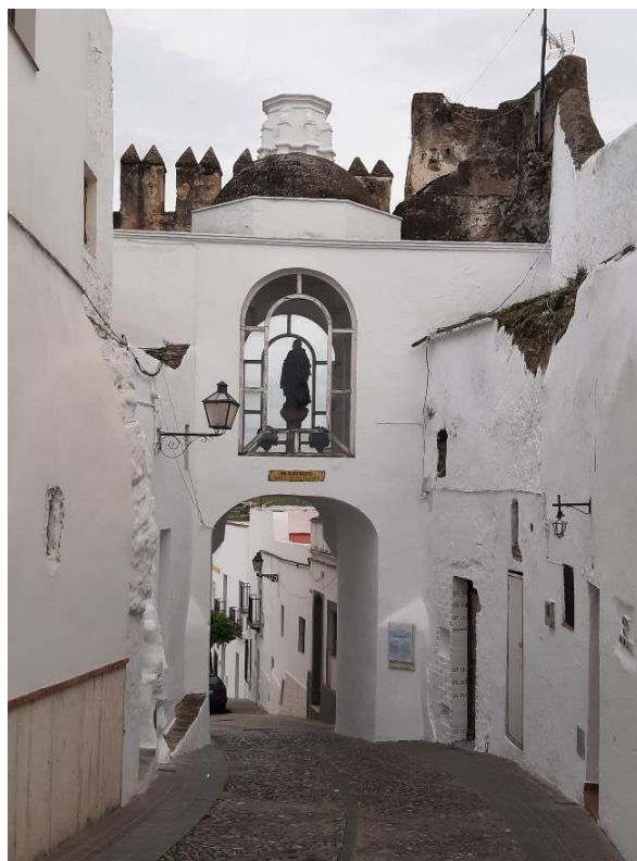
Figura 2.7: Puerta Matrera.

Al estar situada en la vía pública, su gestión es potestad del ayuntamiento, que, entre otras cosas, ha llevado a cabo una iniciativa de restauración de varios tramos de dicha muralla (se restauraron en varias fases las partes de ésta halladas en la puerta del Cómpea, calle Torres y arco Matrera) (Alonso-Ruiz y García-Pulido , 2013).