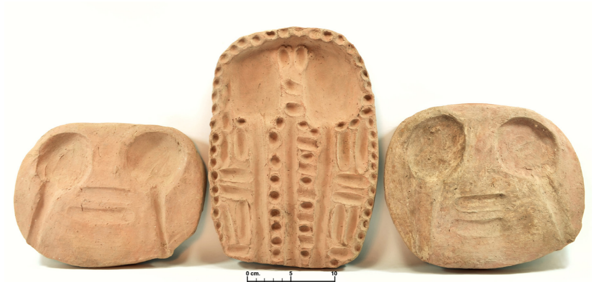
Figura 4. Bandejas de ofrenda, fotografía de Inés García Martínez. © Thutmosis III Temple Project.

Estas bandejas, que tienen los números de inventario 15733 y 15735, presentan una forma ovalada