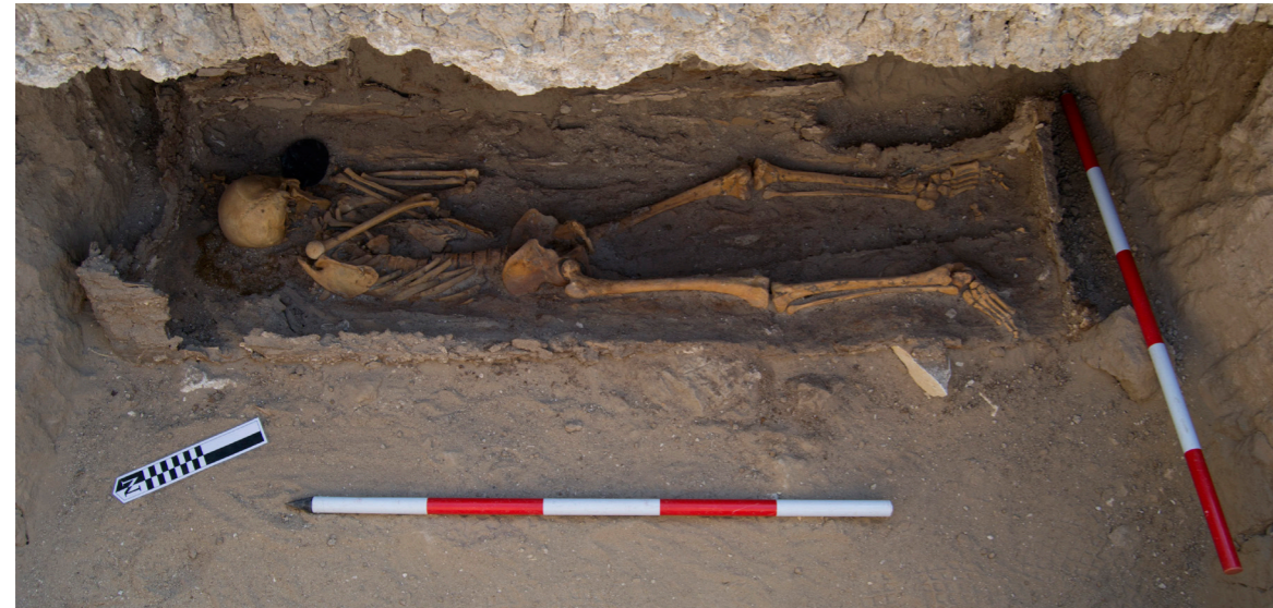
Figura 3. Enterramiento fosa 5, fotografía de Linda Chapón. © Thutmosis III Temple Project.

40 años, con la cabeza orientada hacia el noreste, que ocupaba el también deteriorado ataúd situado en el suelo del nicho.