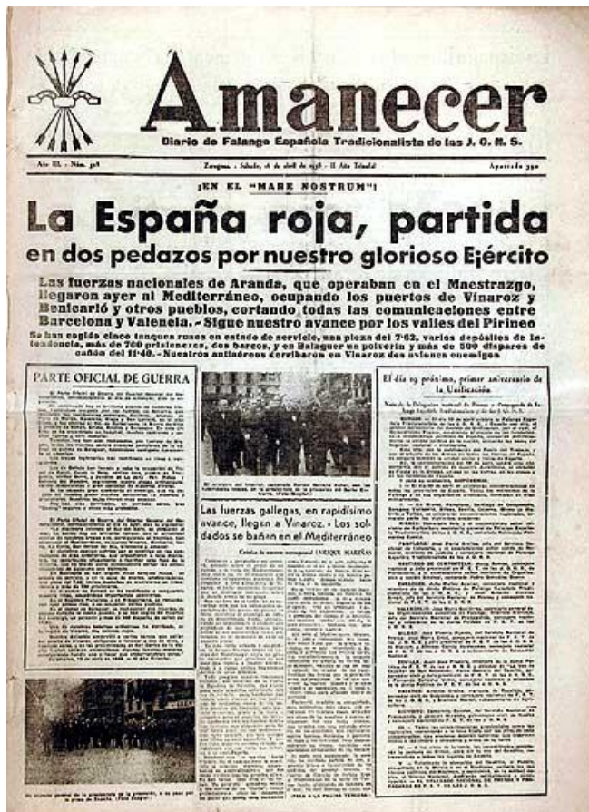
Ejemplar del periódico falangista Amanecer .