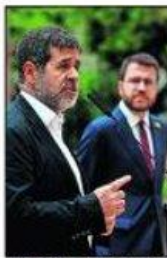
Jordi Sánchez y Pere Aragonés, ayer al anunciar el acuerdo. 72C

das empezó en la madrugada y continuó durante todo el día por la playa del Tarajal, al sur, y por el área de Beni, al norte, sin que los agentes marroquíes opusieran la menor resistencia. La magnitud del flujo migratorio en un solo día no tiene precedentes en la ciudad autónoma y ocurre después de que Rabat elevara la tensión con Madrid tras saber que el secretario general del Frente Polisario, Brahim Ghali, ingresó enfermo de covid, y con una identidad falsa, en un hospital de Logroño. El Ministerio del Interior anunció el envío a Ceuta de 50 agentes de la Guardia Civil y 150 de la Policía Nacional para reforzar los puestos fronterizos y agilizar la devolución de migrantes a Marruecos. Los llegados desbarataron los centros de acogida de la ciudad. Página 17