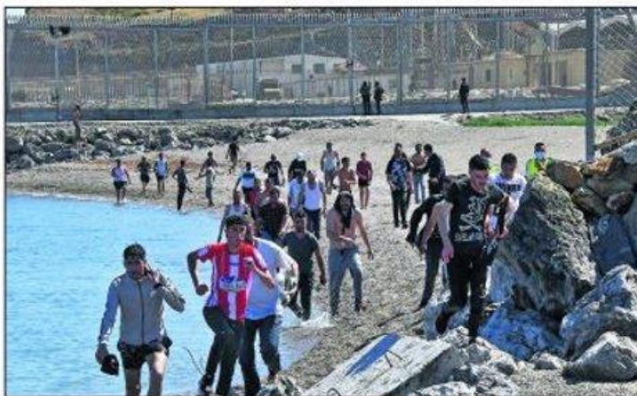
Decenas de jóvenes procedentes de Marruecos entran ayer por el espigón de la frontera del Tarajal en Ceuta. 72A

CULTURA La colección de arte de Pinault enriquece la oferta de París 72D