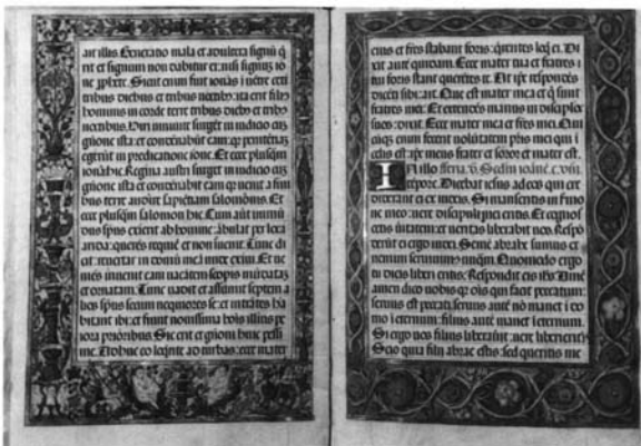
Fotografía 7: Evangeluario, folios 3 vuelto y 4.