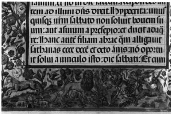
Fotografía 8: Evangeluario, folio 38 vuelto, detalle.