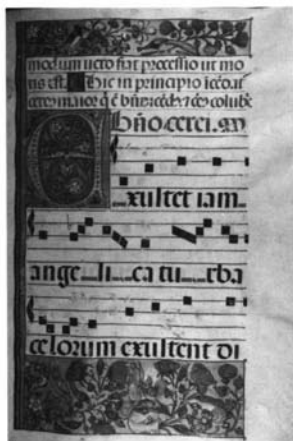
Fotografía 1: Cantorale, folio 56.