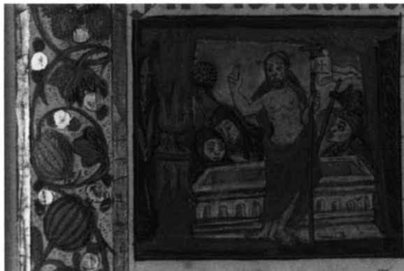
Fotografía 12: Ordo Epistolarum, folio 31. Resurrección.