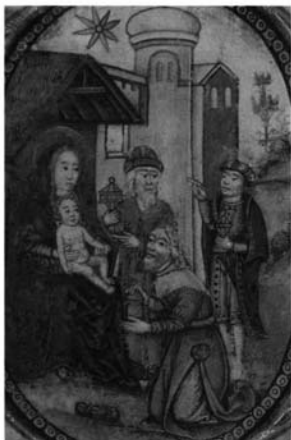
Fotografía 3: Cantorale, folio 13. Adoración de los Magos.