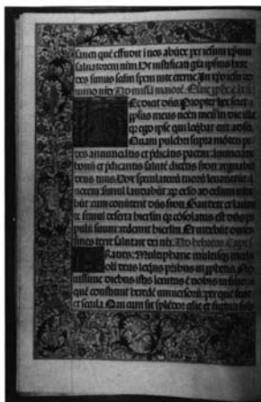
Fotografía 11: Ordo Epistolarum, folio 4 verso.