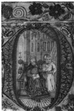
Fotografía 2: Cantorale, folio 1 vuelto. San Marcos.