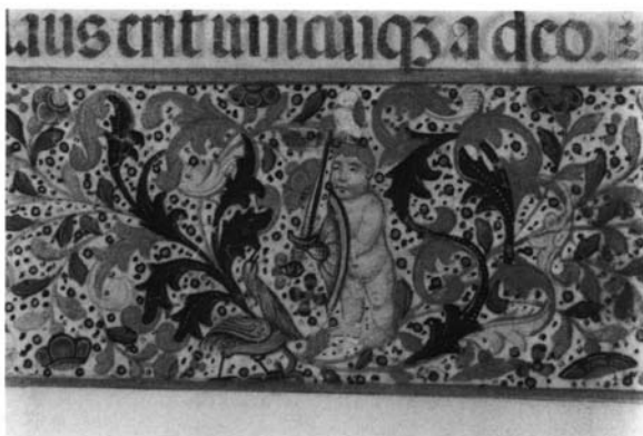
Fotografía 10: Ordo Epistolarum, folio 1 bis, detalle.