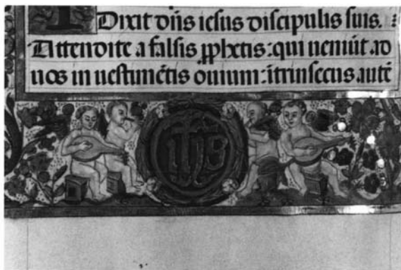
Fotografía 9: Evangelario, folio 31 vuelto, detalle.