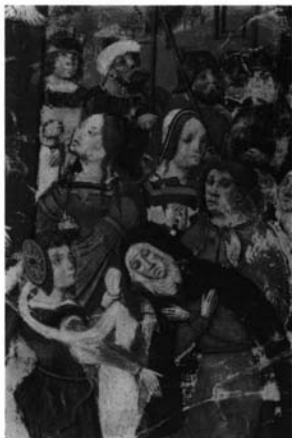
Fotografía 4: Misal de Sevilla, folio 82 vuelto. Calvario, detalle.