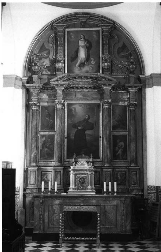
Lámina 2.- Retablo del sagrario. Convento de monjas del Espíritu Santo, Sevilla. Francisco de Acosta el Mozo, ¿c. 1791?