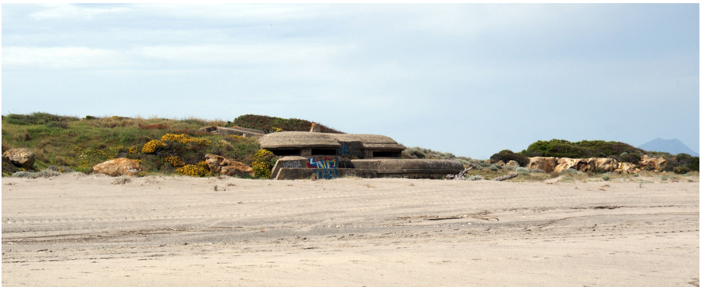
Búnker I.A.28 en Punta Mala, playa de San Roque, Cádiz

URL de la contribución < www.iaph.es/revistaph/index.php/revistaph/article/view/5035 >