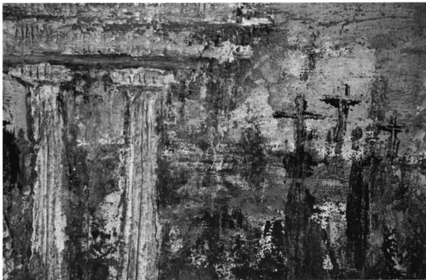
7.- La crucifixión. Joaquín González, 1993-94.