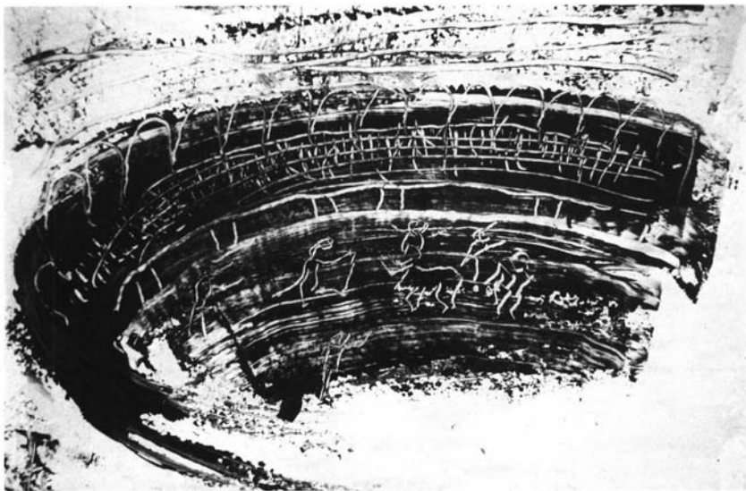
8.- Gesto y lidia. Serie de la tauromaquia. Joaquín González, 1995.