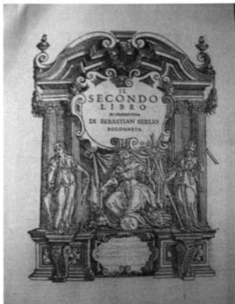
Fig. 10. Libro II . Sebastiano Serlio. Portada