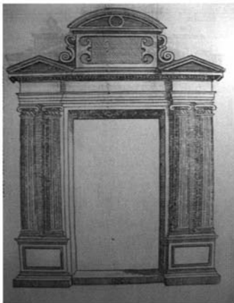
Fig. 5. "Portada delicada". Libro Extraordinario . Sebastiano Serlio.

A simple vista puede apreciarse que las primeras custodias de Alfaro son organismos sometidos a las normas clásicas de la proporción basadas en el sistema de los órdenes. Con un poco más de observación, se comprobará que los órdenes, en lo que concierne a su morfología, delatan el magisterio del Libro IV de Sebastiano Serlio, la guía omni-