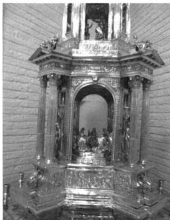
Fig.4. Custodia de Écija. Frontones sobre los soportes.

mármol y jaspes destinado al Sagrario, pieza extraordinaria por su monumentalidad que no llegó a finalizarse quedando inacabada en la década de los 80. 16 La parca descripción que nos queda nos lo dibuja como templete circular de varios cuerpos y columnas emparejadas, restando por saber si la afición del arquitecto por los temas triunfales no pudo quizás llevarle al empleo de la “travata rítmica” como base de su organización estructural e influir con ello la decisión estructural de Alfaro. Sorprendentemente, el tercer cuerpo de nuestras custodias asume la forma de un tholos o templete circular de columnas pareadas, fórmula original que de nuevo evoca las estructuras intuitas de ese gran tabernáculo de Hernán Ruiz II que, dadas sus dimensiones y novedad, debió provocar, aún sin terminar, un gran impacto en la Sevilla de entonces.