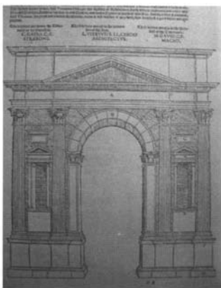
Fig. 3. Arco de triunfo. Sebastiano Serlio. Libro IV .