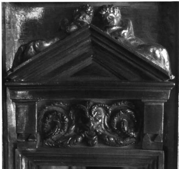
Fig. 8. Custodia de Marchena. Detalle. Ménsula-triglifo lisa.

La serie de las custodias de Marchena, Écija y Carmona juega con soltura a la variación sobre un tema directamente tomado de las portadas de libros, especialmente de arquitectura. Nos referimos a la escenográfica disposición de figuras de bulto en los templete ochavados de base de las tres custodias. En ellas, las miguelangelescas figuras de profetas apoyadas sobre pedestales amensulados, método asimismo propio de los retablos romanistas, se sitúan dentro de los pórticos, al nivel de los soportes e incluso antepuestas a éstos últimos, según cada caso; aisladas o emparejadas (Fig. 9). Es decir, Alfaro exprime las posibilidades del juego de planos en la relación de las formas escultóricas con las arquitectónicas.