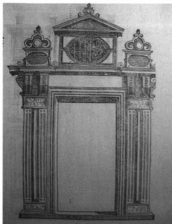
Fig. 7. "Portada delicada". Libro Extraordinario . Sebastiano Serlio.

(Fig. 8). Diseño personal de Miguel Ángel, la ménsula plana puede verse ostentosa en la Puerta Pia de Roma, su difusión quedó en manos de dibujos y grabados, y sólo a partir de la década de los 90 aparece en las ediciones españolas de la Regola delli Cinque Ordine d'Architettura de Vignola. Es en esas ediciones de Caxesí donde por primera vez aparece en el libro de Vignola una imagen del motivo en el grabado XXXVIII dedicado a la Puerta del Campidoglio de Roma. 23 Es por tanto imposible que Alfaro extrajese esa fórmula de algún ejemplar italiano del Vignola en los años 70. Lo más probable es que la inspiración procediese de algún dibujo o grabado quizás en manos de Jerónimo Hernández o de algún artífice de su entorno. 24