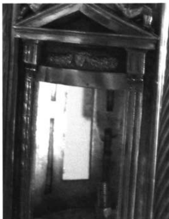
Fig. 6. Custodia de Marchena. Detalle. Pilastra-triglifo

Es el caso del uso infrecuente de ménsulas planas y de superficie lisa, a modo de incompletos triglifos de los que han desaparecido las estrías y en los que se conserva un número caprichoso de gotas. En la Custodia de Marchena aparecen sosteniendo frontones en las fachadas interiores y ostentan sólo un par de gotas en su parte inferior