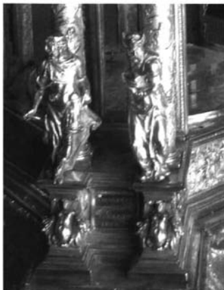
Fig. 9. Custodia de Marchena. Figuras sobre pedestales.

obra circulante por Sevilla como demuestra su manejo por Hernán Ruiz el Joven. 25 En ella, una figura alegórica sobre una ménsula antepuesta al pedestal flanquea cada lado del pórtico, situada en un plano anterior al de las columnas (Fig. 10). No obstante, el adelantamiento de figuras con respecto al plano arquitectónico, que es el modelo más atrevido seguido en la custodia de Marchena, se convierte en una constante de las portadas de libros del periodo manierista. Así puede verse en la edición príncipe de 1570 de Quattro Libri dell'Architettura de Andrea Palladio, una obra que Alfaro pudo conocer tempranamente a través de Jerónimo Hernández, o en ediciones ya posteriores a las piezas de Alfaro como las españolas de Vignola y Vitruvio de 1582. 26