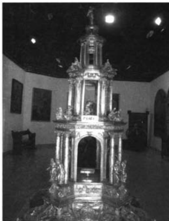
Fig.1.Custodia de Marchena. Estructura de arco de triunfo.

probablemente el estímulo más directo fuese hallado por el orfebre en la obra del arquitecto Hernán Ruiz el Joven. El Libro III del boloñés ofrecía de manera muy directa numerosos ejemplos antiguos del tema, mostrando gran semejanza compositiva con la custodia de Marchena el Arco del Castel Vecchio de Verona y su gran arco central, sus vanos laterales coronados por frontones y los huecos superiores rectangulares 11 (Fig. 3). Asimismo, el llamado Libro Extraordinario de Serlio, dedicado al diseño de portadas, ofrecía algunos modelos basados en el arco triunfal. Entre las llamadas portadas “delicadas” con ese tema, la número XI, con edículos laterales, presenta una organización muy similar a la empleada por Alfaro. 12 Que el orfebre conocía estas obras teóricas de Serlio en Sevilla, no sólo