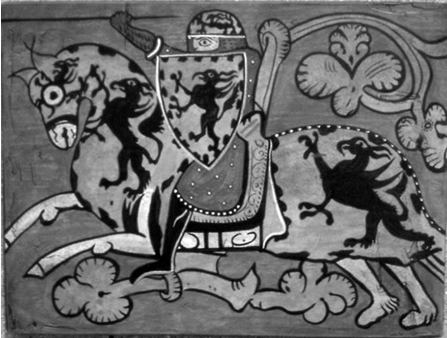
Figura 1. Caballero. Detalle tabla ensamblaje entre jácenas del Palacio del Marqués de Llió (1300). Barcelona, Museo Nacional de Arte.