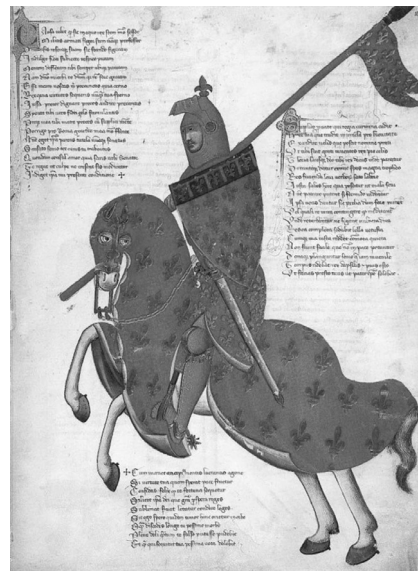
Figura 2. Regia carmina di convenevole da Prato por Boccaccio. Siglo XIV. Del pueblo de Prato a su protector Roberto D'Anggio. Londres, British Museum.