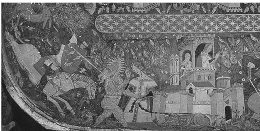
Figura 6. Caballero islámico alanceando a un salvaje que se apodera de una dama. Salón de los Reyes. Alhambra de Granada, siglo XIV.