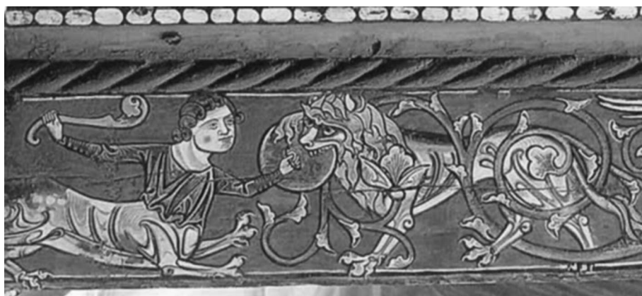
Figura 4. Lucha entre centauro y león. Artesonado catedral de Teruel. Entre 1295-1305.