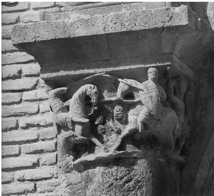
Figura 3. Roland contra Ferragut. Palacio de los Reyes de Navarra en Estella. Siglo XII.