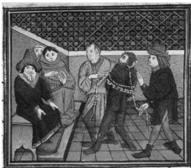
Figura 8. Merlín como salvaje ante el Rey Arturo. Historia del Santo Grial y de Merlín. Siglo XV. Nueva York, Pierpont Morgan Library.