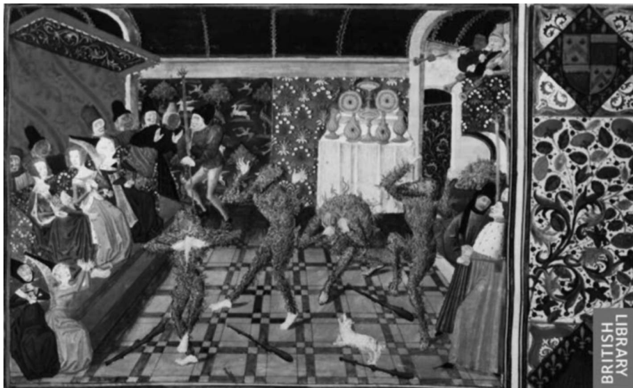
Figura 7. Chroniques de Jean Froissart Vol. IV, parte II (s. XV). Ms. Harley 4380. Londres, British Library.