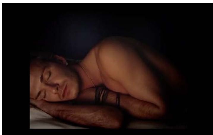
Fig. 5: Sam Taylor-Wood, David, 2004.