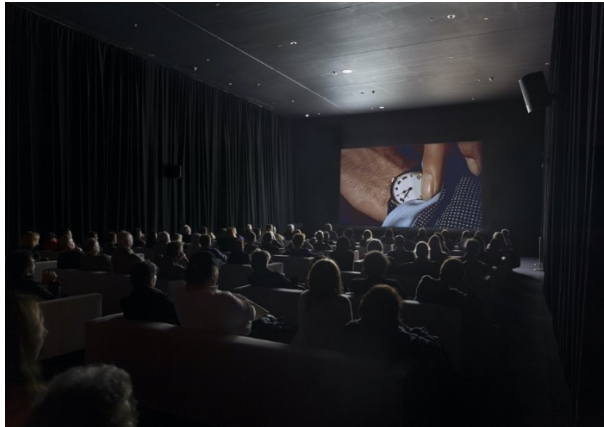
Fig. 3: Christian Marclay, The Clock , 2010. Instalación monocal, 24 horas, loop . ©MoMA

time there. You have to eat, you have to feed your kids or the dog, water the plants... (Myers, 2018).