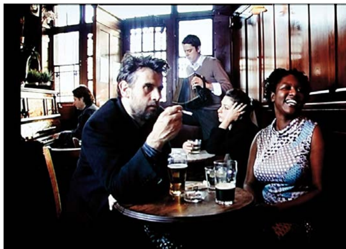
Fig. 4: Sam Taylor-Wood, The Last Century , 2005. ©Sam Taylor-Smith.

Mientras Viola proporciona esos tiempos de espera a través de la dilación forzada (estrategias de ralentización mediante), Marclay lo hace a través de la sincronización (por amalgamación) de heterogéneos instantes de tiempo(s). Sam Taylor-Wood, por su parte, propone en su obra The Last Century (2005) una estrategia distinta: la inacción (tanto a nivel conceptual como de contenido). Lo que a primera vista se advierte como la imagen estática de un grupo de personas, ante la mirada detenida y atenta se desvela como una toma de vídeo cuya duración está marcada por la consunción de un cigarrillo encendido. La duración total del video es de 7 minutos y 42 segundos, y en él los únicos movimientos son los espasmos, parpadeos involuntarios y la respiración casi imperceptible de los actores, pasivos, todos dispuestos de manera grupal alrededor de una mesa, como en los retratos de grupo pintados por Rembrandt y otros maestros clásicos.