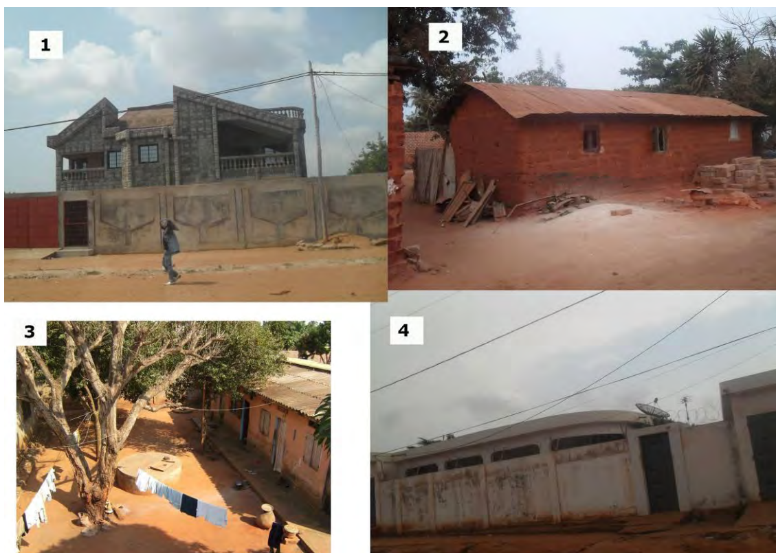
1. Vivienda ostentosa de élite. 2. Autoconstrucción sobre suelo ocupado. 3. Interior de una casa comunal. 4. Vivienda familiar con características de bunker.