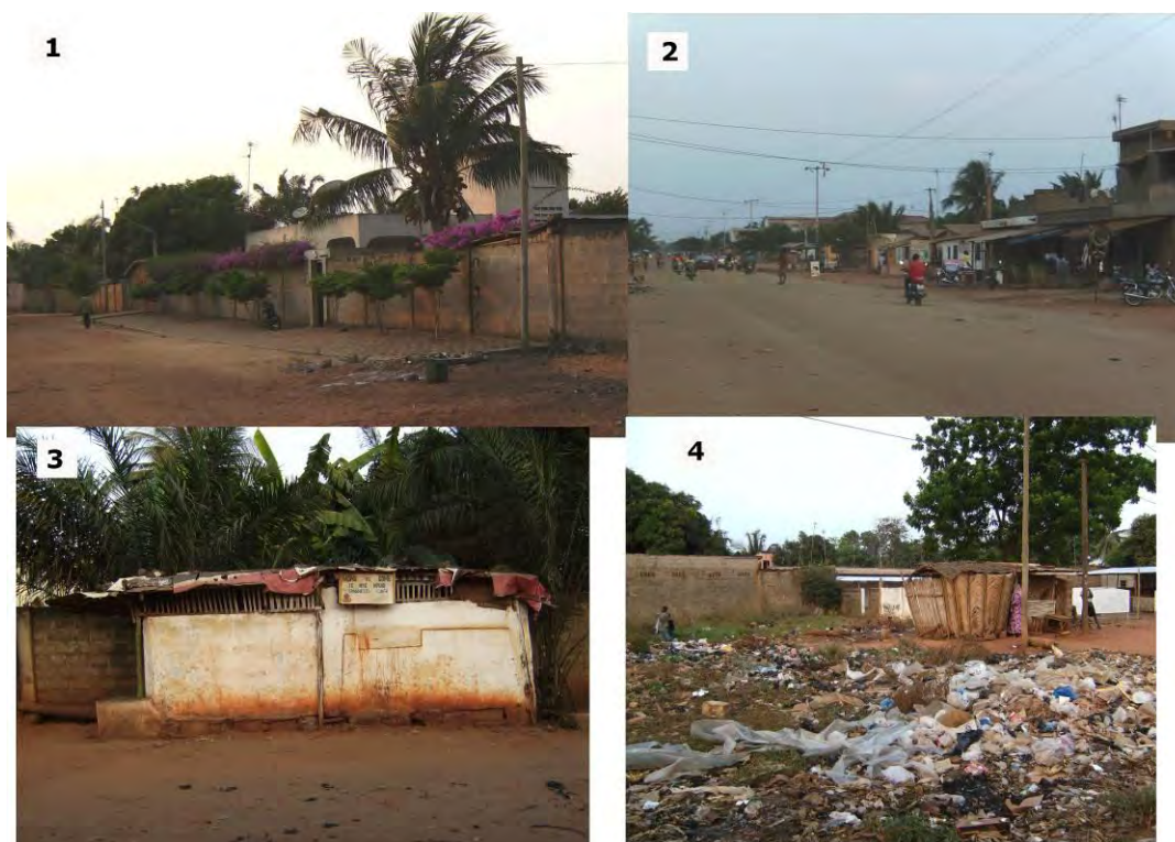
1. Autourbanización. 2. Moto-taxis. 3. Kiosco-restaurante ocupando la vía pública. 4. Acumulación de basuras en la vía pública.

A la ausencia de infraestructuras se le suma la ausencia de servicios básicos, y la ausencia más fácilmente apreciable es la carencia de un sistema de recogida de basuras. Envases de todo tipo, fruto de la actividad comercial y el consumo familiar, se acumulan por todas partes cubriendo a veces tramos de calle enteros y dificultando la circulación. El único tratamiento que le pueden dar los vecinos es la quema por las noches o su acumulación en zanjas cavadas para tal propósito. Sin embargo estos tratamientos desorganizados son a todas luces insuficientes, como puede observarse en la figura 4.