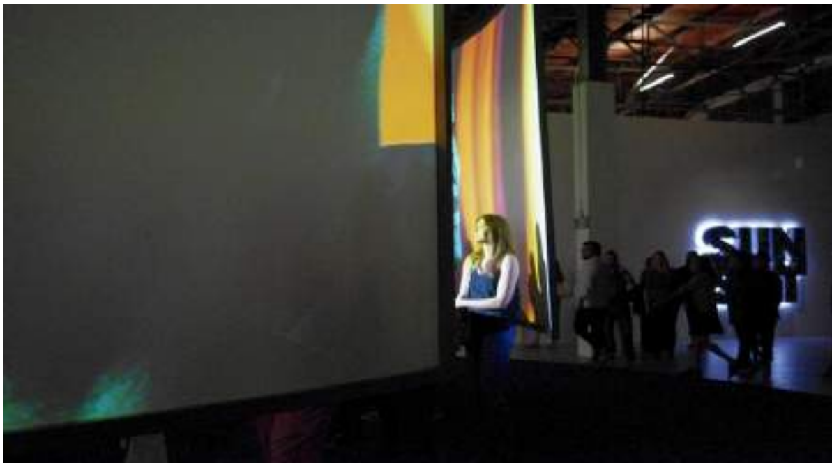
Imagen 1. Aitken, D. (1999). Electric Earth [en línea, Instalación de video de ocho canales y entorno arquitectónico, medidas variables.]

Pasear puede ser una experiencia asombrosa, impulsados por nuestras piernas, encontramos ritmos y tempos. Nuestros cuerpos se mueven en ciclos repetitivos y mecánicos. Perdemos el hilo de nuestras divagaciones. El tiempo se nos escapa; se estira y se condensa. A veces la velocidad de nuestro entorno no está sincronizada con la percepción que tenemos de él. Cuando eso sucede, se crea una especie de zona gris, un estado de flujo que me fascina. (como se citó en Heartney, 2008, p. 158)